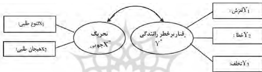
شکل ۲- نمودار علی تجربی رفتارهای پرخطر رانندگی و تحریک جویی

باتوجه به نتایج حاصل از محاسبه ضریب همبستگی ( \rho ) میان دو متغیر کانونی تحریک جویی ( X^* ) و رفتار پرخطر رانندگی ( Y^* ) و همچنین وزن های کانونی ( a, b ) مربوط، نمودار علی تجربی این دو تابع را می توان مطابق شکل (۲) ترسیم کرد.