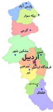
شکل ۱- نقشه جغرافیایی استان اردبیل