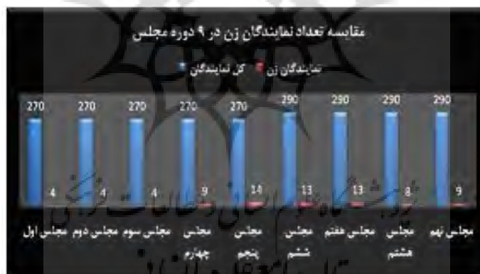
نمودار ۱. مقایسه تعداد نمایندگان زن در ۹ دوره مجلس شورای اسلامی