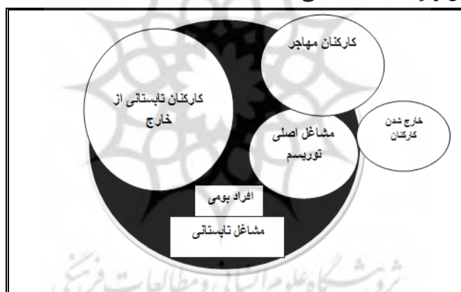
نمودار ۱- گروه‌های متفاوت کاری استخدام شده در یک مقصد فصلی گردشگری

باتلر و ماو ۱ (۱۹۹۷) بیان می‌کنند که فصلی بودن در مقاصد مختلف گردشگری (با توجه به ماهیت جاذبه‌ها) باعث ایجاد تعداد دوره‌های مختلف رونق گردشگری می‌شود (Karamustafa et al, 2010). یک دوره پررونق ۲ ، دو دوره پررونق ۳ و بدون دوره پررونق ۴ . از جمله مقاصد گردشگری دارای یک دوره رونق، کشورهای حوزه دریای مدیترانه‌اند که با توجه به ماهیت جاذبه‌های آن کشورها، ۳۷ درصد جریان‌های گردشگران ورودی فصلی بوده و فصل تابستان به عنوان فصل شلوغ و پررونق گردشگری آن‌ها محسوب می‌شود. باتلر ۵ (۱۹۹۴) در مورد آنچه که موجب به وجود آمدن فصلی بودن و این دوره‌های متفاوت رونق در مقاصد گردشگری می‌شود بحث کرده و در واقع دو نوع فصلی بودن را از هم تفکیک می‌کند: فصلی بودن طبیعی فصلی بودن سازمان یافته: فصلی بودن طبیعی حاصل تغییرات منظم شرایط اقلیمی مثل باد، بارش برف و باران و میزان تابش آفتاب است و فصلی بودن سازمان یافته حاصل تصمیمات و فعالیت‌های انسانی بوده و نسبت به فصلی بودن طبیعی، بیشتر قابل پیش‌بینی است و نتیجه ترکیبی از فاکتورهای دینی و مذهبی، فرهنگی، قومی و اجتماعی است. مثل دوران تعطیلات مذهبی، زمان عبادت ادیان و تعطیلات مدارس و صنعتی (Baum et al, 2001: 5). وی فصلی بودن گردشگری را به عنوان «عدم تعادل موقت در این صنعت» تعریف کرده و تعداد گردشگران ورودی، مدت اقامت و درآمد (هزینه‌های پرداختی) ناشی از آن‌ها را نیز به عنوان مقیاسی برای سنجش این پدیده ذکر می‌کند (Koenig-lewis et al, 2010). بام از پیشگامان مباحث مربوط به صنعت گردشگری، اشتغال و فصلی بودن گردشگری نیروی انسانی شاغل در بخش گردشگری را به صورت شکل زیر دسته‌بندی می‌کند: