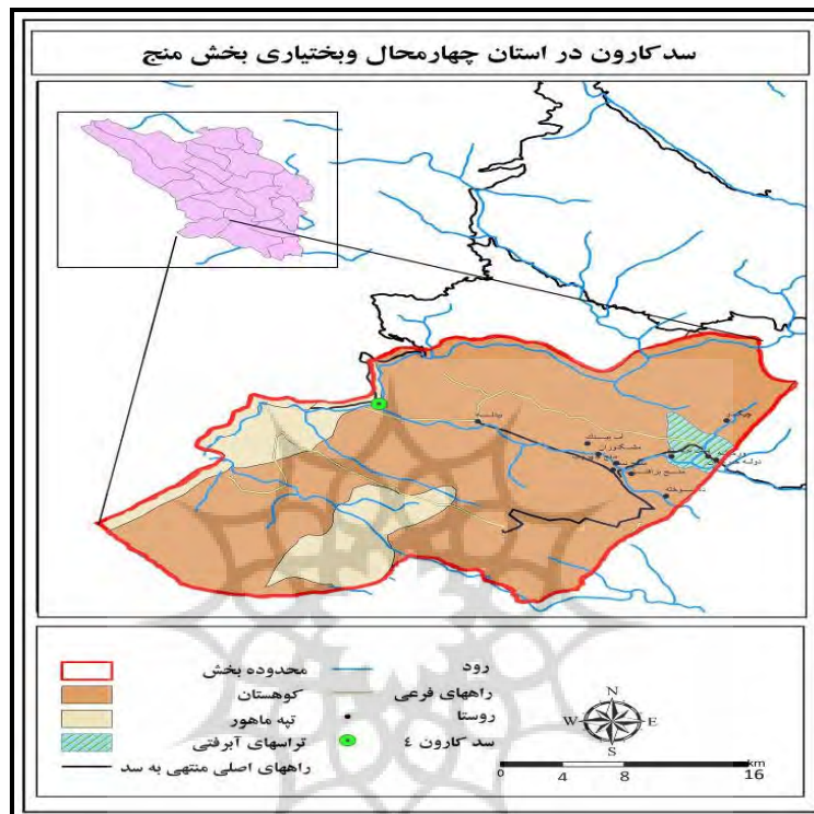
شکل شماره ۱، نقشه موقعیت سد کارون ۴ در استان چهارمحال و بختیاری

۵۷ ثانیه عرض جغرافیایی که توسط شرکت مهندسی مشاور «مهتاب قدس» و شرکت توسعه منابع آب و نیروی ایران منعقد گردیده، هم اکنون مراحل پایانی خود را طی می‌کند. این سد اولین سد در مسیر کارون نسبت به سرچشمه بر روی رودخانه کارون و بلندترین سد بتنی دو قوسی ساخته شده در کشور با ارتفاع ۲۳۰ متر است. تنظیم آب رودخانه کارون به میزان سه میلیارد و ۷۰۰ میلیون متر مکعب در سال، کنترل طغیان و سیلاب‌های مخرب رودخانه کارون، تولید انرژی برق آبی به میزان دو میلیارد و ۱۰۷ میلیون کیلووات ساعت از جمله اهداف ساخت سد کارون ۴ است (مهندسان مشاور طراحان البرز، ۲۰۰: ۱۳۹۰).