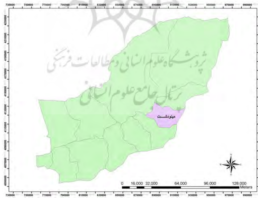
نقشه ۲: موقعیت مینودشت در استان گلستان