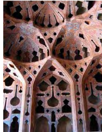
تصویر ۶. وجود عناصر تزئینی به شکل آلات موسیقی در تالار موسیقی کاخ عالی قاپو. مأخذ: همان.

گفت‌وگوی موسیقی‌وار چهار مرتبه در منظومه ادامه می یابد و از هر دو سوی، تعارف‌ها و هجران‌ها و اشتباهات گذشته و سخنان نغز عاشقانه و اظهار پیشیمانی از کوتاهی‌ها رد و بدل می شود. در قطعه «بیرون آمدن شیرین از خرگاه» نیز همراه با معاشقه این گفت‌وگوها همچنان ادامه دارد.