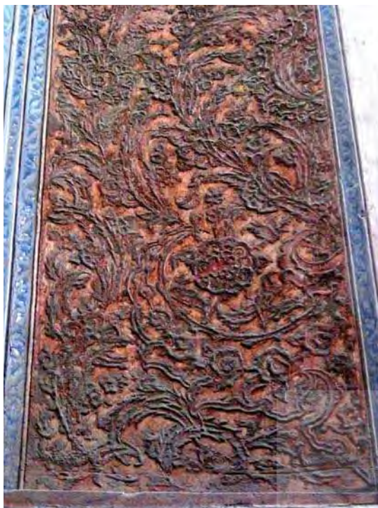
تصویر ۱. قسمتی از ستون تالار موسیقی کاخ عالی قاپو. فرم و حرکت اسلیمی‌ها به خوبی وصل و هجران را به تصویر می‌کشند.