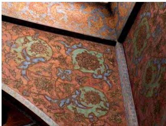
تصویر ۳. قسمتی از دیوارهای اتاق موسیقی. رنگ‌های سبز در کنار رنگ‌های قرمز مشخص است.