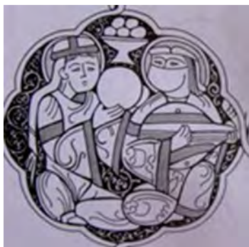
تصویر ۵. دو نفر در حال نواختن بربط و دف.

پژوهشی در شیوه‌های ساخت و مضمین مکتب فلزکاری موصل مطالعه‌موردی: صندوقچه و شمعدان بدرالدین لؤلؤ