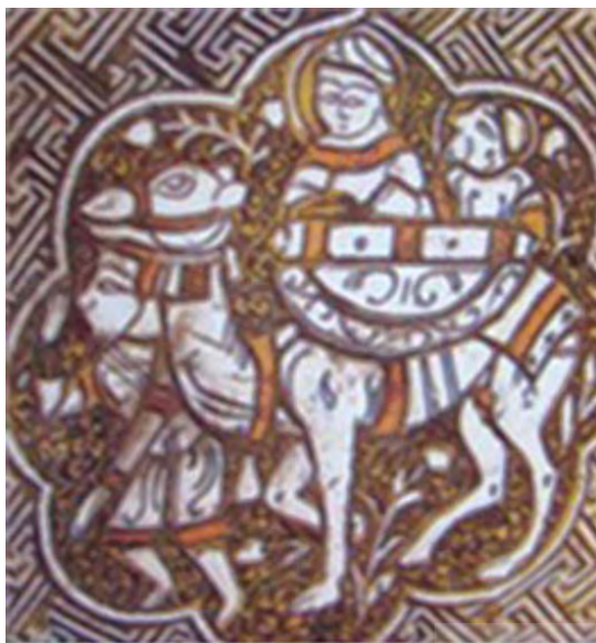
تصویر ۱. بهرام گور و آزاده در یکی از ترنج‌های ترصیع‌کاری شده آبریز شجاع بن منعه موصلی.

۱. بسیاری از موضوعات تزئین و نیز شیوه ساخت آثار و نیز شکل‌های دوره ساسانی در آثار فلزی دوره سلجوقی و از آنجا نیز توسط هنرمندان مهاجر خراسانی به مکتب موصل و آثار فلزی این شهر راه یافت. ۲. مکتب درخشان فلزکاری خراسان رفته‌رفته با شروع جنگ‌های خونین و زدوخوردهای محلی و هجوم اقوام مهاجم نظیر حمله مغولان به خراسان و ایران دچار آشفته‌گی شد و هنرمندان فلزکار خراسانی مجبور به ترک وطن خود شدند. در سایر شهرها مانند زنجان، بروجرد، همدان، تبریز و به‌ویژه در شهر موصل که در آن روزگار بخشی از حوزه تمدنی و جغرافیایی ایران محسوب می‌شد اقامت گزیدند. نکته شایان توجه این است که متأسفانه خاورشناسان به‌ویژه پژوهشگران انگلیسی بدون پژوهش کافی و شاید بنابر اغراض سیاسی این دسته از هنرمندان مهاجر ایرانی را عراقی قلمداد کرده‌اند، در صورتی که در دوران سلجوقی و بعد از آن عراق به عنوان بخشی از ایالات ایران شمرده می‌شد و انتساب این رشته از هنر والای ایرانی به آنان گمراه‌کننده است (احسانی، ۱۳۸۶: ۱۴۱).