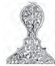
تصویر ۱۲. تزئینات گیاهی و نباتی روی آثار فلزی که به صورت پیچ در پیچ و درهم فرورفته حکاکی و ترصیع شده است.