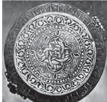
تصویر ۱۶ ب. درپوش صندوقچه بدرالدین لؤلؤ