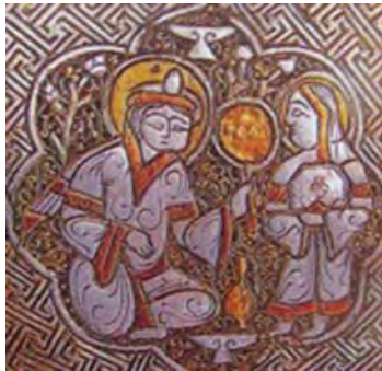
تصویر ۸. بانویی تصویر خود را در آینه می بیند در حالی که کنیز و ملازم وی صندوقچه جواهرات به دست دارد.