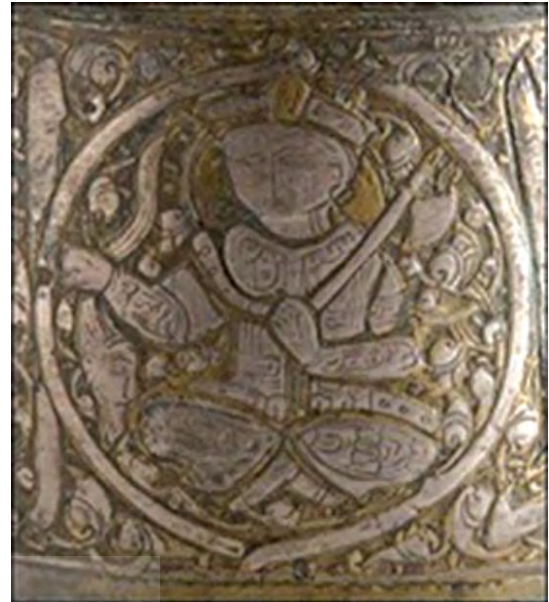
تصویر ۲. نقش نمادین بهرام که در یک دست تبر و در دست دیگر یک سر بریده دارد.

در سال ۱۹۴۴ دیماندا ۶ در کتاب هنرهای اسلامی به موضوع آثار فلزی و فلزکاری پرداخت و دو صفحه از کتاب را به آثار هنری سلجوقیان در عراق اختصاص داد. در این دو صفحه وی اهمیت موصل در زمینه هنر فلزکاری را در طی قرن هفتم هجری یادآور شده و تعدادی از آثار فلزی موصل را برشمرده است (دیماندا، ۱۹۵۸: ۸۷). دکتر زکی محمدحسن در کتابی تحت عنوان هنرهای اسلامی فصلی را به آثار فلزی اسلامی اختصاص داده است. او در شش صفحه این فصل، درباره آثار فلزی موصل در طی قرن هفتم بحث کرده است (زکی، ۱۹۴۸: ۱۰۵-۸۷). وی همچنین در کتاب اطلس هنرهای تزئینی ۱۱۳ اثر فلزی جهان اسلام را بررسی کرده است که پنج اثر آن به مکتب فلزکاری موصل اختصاص دارد (زکی، ۱۹۵۶). خاورشناس دیگری به نام دوگلاس باریت پژوهشی را در ۲۴ صفحه درباره آثار فلزکاری اسلامی که در موزه بریتانیا قرار دارد نوشته و به اهمیت شهر موصل به عنوان یکی از مراکز فلزکاری و نیز تأثیر این هنر بر آثار هنری نفیس سوریه و مصر و پراکنده‌شدن فلزکاران موصل در برخی شهرهای اسلامی اشاره کرده است (Barrett, 1945). دیوید تالبوت رابیس یکی از افراد برجسته‌ای است که درباره آثار فلزی دوران اسلامی تحقیقات فراوانی داشته است، وی سلسله مقالاتی در دهه چهل میلادی درباره آثار فلزی منتشر ساخت. او در سال ۱۹۴۹م به بررسی قدیمی‌ترین شمعدان موصلی پرداخت. وی در این تجزیه و تحلیل شمعدان مذکور را با ظرافت و ریزه‌کاری خاصی با ذکر تمام جزئیات توصیف کرد و نظرات خود را در ارتباط با تصویر و شکل این شمعدان بیان کرد (Rice, 1949). رابیس در سال ۱۹۵۳م پژوهشی را درباره بررسی دقیق سه قطعه از آثار فلزکاری موصل و برطرف کردن خطای پژوهشگران پیش از خویش در مجله مطالعات شرق و آفریقا منتشر کرد (Rice, 1953).