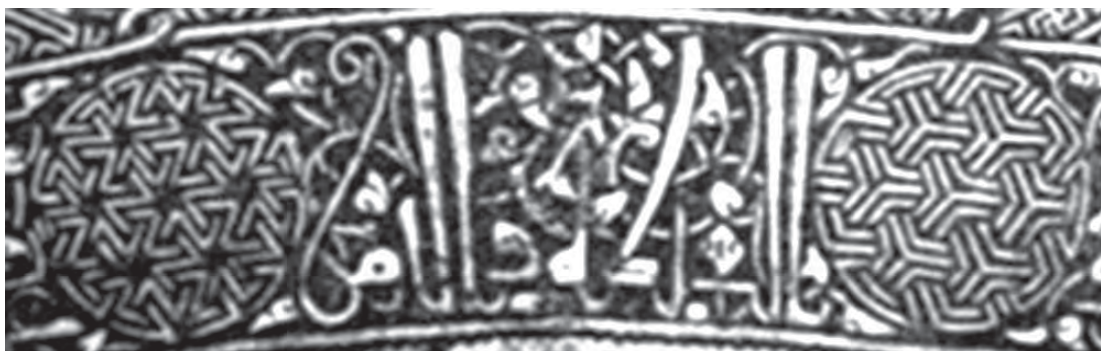
تصویر ۱۵. نقوش هندسی به شکل Y و Z که به صورت فرورفته و وارونه روی آثار فلزی موصل کنده‌کاری و مرصع‌کاری شده است. مأخذ: همان