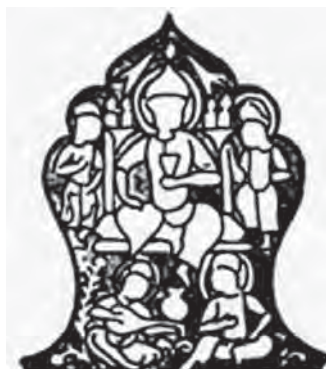
تصویر ۹. سلطانی نشسته بر تخت و جامی در دست به همراه ملازمان. مأخذ: العبیدی، ۱۹۷۰: ۸۵

سریع و کارآمد برای بازآفرینی اشیا و موردپسندترین روش ریختگری روش قالب‌گیری و ریختگری با موم است» (Ward, 1993: p.31).