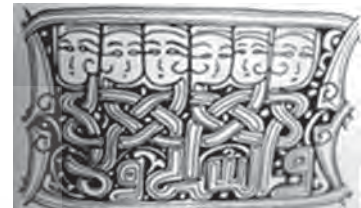
تصویر ۱۴. نقوش هندسی به شکل T که به صورت فرورفته روی آثار فلزی موصل کنده کاری و مرصع کاری شده است. اطراف ترنج رانقوشی به شکل T فرا گرفته است.