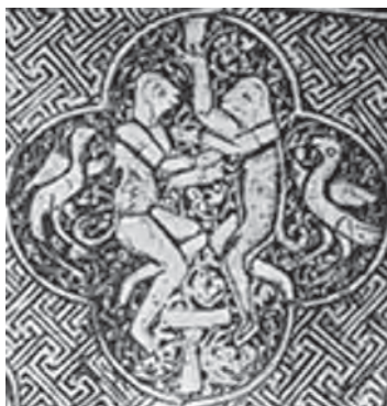
تصویر ۱۱. حیوانات یا موجوداتی خیالی و افسانه‌ای و بعضاً به شکل انسان.