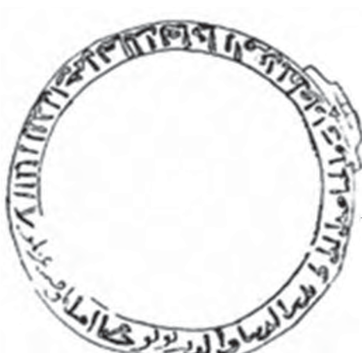
تصویر ۱۷. کتیبه نوار بیرونی درپوش، به خط نسخ. مأخذ: العبيدی، ۱۹۷۰: ۵۷

بزرگ و کوچک شدن و تکرار متقارن و گسترش‌یابنده را از داخل به خارج و برعکس را دارند» (Baer، ۱۹۸۹: ۸۶). بنابراین «طرح‌های تزئینی مبتنی بر هندسه تمام سطوح را زیر پوشش می‌گیرد» (ویلسون، ۱۳۷۷: ۴۱). مهم‌ترین ویژگی عناصر تزئینی هندسی در این آثار تنوع و گونه‌گونگی است. یک نظام تزئینی دارای تصاویر و دیگر نقوش تزئینی بر زمینه‌ای هندسی قرار دارد که اساس شکل آن حرف لاتینی T (تصاویر ۱۴) دو سرکج است و گاهی این اشکال هندسی به شکل یک عنصر تزئینی هشت‌ضلعی ظاهر می‌شود. نوع دیگری از نقش‌های هندسی که بر سطح آثار فلزی موصل حکاکی و کنده‌کاری شده است اشکالی است شبیه حرف لاتینی Y و Z (تصویر ۱۵).