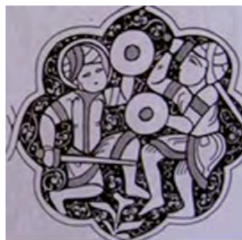
تصویر ۴. جنگجویان در حال نبرد. مأخذ: همان