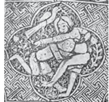
تصویر ۶: دو فرد در حال کشتی گرفتن