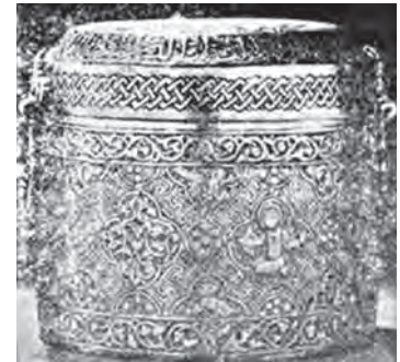
تصویر ۱۶ الف. صندوقچه بدرالدین لؤلؤ، مأخذ: العبيدي، ۱۹۷۰

پرنندگان کوچک دیگر که می‌توان نام برد. همچنین «تصاویر حیوانات خیالی و افسانه‌ای نیز مانند پیکر ابوالهول، شیرهای بالدار (الگوی ایرانی)، گریفین ۱ (تصویر ۱۱)» (العبيدي، ۱۹۷۰: ۲۰۸) در تزئین آثار موصلی استفاده شده است. از دیگر تزئینات رایج در آثار موصلی می‌توان به تزئینات گیاهی و نباتی اشاره داشت که به صورت‌های متنوعی به کار رفته است (تصویر ۱۲). هنرمند فلزکار اشکال درختان و گیاهان را نه به طور طبیعی بلکه به صورت انتزاعی به کار برده است و این ویژگی غالب اشیای فلزی موصلی در تزئینات گیاهی است. این نوع از تزئین به صورت شاخه گیاهی درهم پیچیده که از آن گل و برگ‌هایی بیرون آمده است، روی نوارهای پارگی حکاکی و مرصع‌کاری شده است. همچنین «بیشتر آثار موصلی دارای شاخه‌های گیاهی کوچکی است که در لابه‌لای تصاویر و نقوش دیگر قرار دارد. نظیر این شاخه‌ها را در شکل‌های نقاشی مکتب عباسی شاهد هستیم» (محمدحسن، ۱۹۵۵: ۳۵). به نظر می‌رسد هدف از تزئینات گیاهی پر کردن جاهای خالی میان دیگر عناصر تزئینی است. تزئین گیاهی در برخی از آثار خود زمینه‌ای می‌شود برای موضوعات مختلف و اشکال گوناگون. ویژگی این نوع از تزئین شدت پیچش آن است و دارای همان اهمیتی است که دیگر تصاویر و عناصر تزئینی از آن برخوردارند. یک نمونه از عناصر گیاهی نقوش اسلیمی و آرابسک است که در بعضی از آثار تقریباً تمامی سطح یک ظرف را می‌پوشاند. در بعضی مواقع تزئینات گیاهی ارزش ذاتی دارند، بدین معنی که تزئین و زیبانگاری گیاه هدف هنرمند در ساخت تصویر و نقش بوده است.