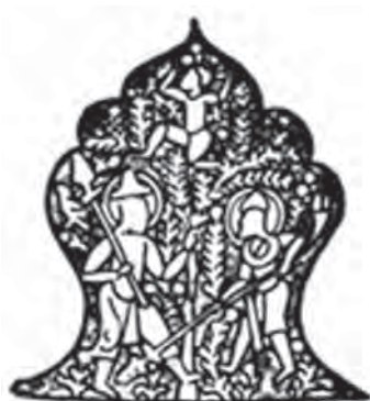
تصویر ۱۰. صحنه‌های زندگی روزمره کشاورزان در مزرعه و در حال کار. مأخذ: همان