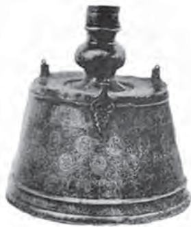
تصویر ۱۶ پ. شمعدان بدرالدین لؤلؤ، مأخذ: همان، ۱۹۹۳: ۷۸.