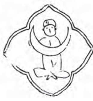
تصویر ۷. مردی به صورت چهارزانو نشسته و هلال ماه در دست گرفته