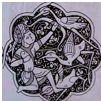
تصویر ۳. شکارچی به صورت پیاده در حال شکار پرنده‌گان.

جزیره العرب و عراق و موصل در سال ۱۲۵۶/۶۶۴۸م چنین می‌گوید: «صنایع و حرفه‌های فراوانی در شهر موصل وجود دارد، به‌ویژه ظروف غذایی ساخته‌شده از جنس مس که آن را برای پادشاهان می‌برند» (Barrett, 1945: 14). از این سخن آنچه می‌توان استنباط کرد این است که شهر موصل در ساخت هنرمندانه آثار جایگاهی رفیع داشته است، چنان‌که تقاضای محصولات مسی این شهر درخور طبقه پادشاهان بوده است. پر واضح است که این طبقه اموال کلانی را در راه به‌دست آوردن نفیس‌ترین ابزار و وسایل گرانبها و زینتی هزینه می‌کرده‌اند. آن‌ها به‌واقع گمشده و کمال مطلوب خود را در ظروف غذایی مسی ساخت موصل می‌دیدند. استنباط دیگری که از سخن ابن سعید می‌شود این است که تولیدات شهر موصل به اندازه‌ای فراوان بوده که این شهر را در رأس شهرهای تولیدکننده و صادرکننده آثار فلزی به‌ویژه آثار مسی قرار داده است. این شهر به ساخت آثار گران‌بهای طلایی از جمله چلچراغ‌ها مشهور بوده است. ابن اثیر در جریان بحث از حوادث سال ۵۶۵ق/۱۲۵۸م نقل می‌کند که: «بدرالدین لؤلؤ هر ساله چلچراغی از جنس طلا را با قیمت هزار دینار به مشهد می‌فرستاد» (ابن اثیر، ۱۹۳۲: ۲۱). با توجه به شکوفایی و رونق موصل در هنر فلزکاری و تولید آثار نفیس فلزی به‌ویژه در زمان خود بدرالدین لؤلؤ به نظر می‌رسد که این چلچراغ‌ها در موصل ساخته شده است. در قرن سیزدهم، موصل در شمال عراق یکی از مراکز بزرگ ترصیع‌کاری اسلامی گردید و در حقیقت شهرت و معروفیت این شهر به حدی بود که تا مدتی مدید همه کارهای ترصیع مس و نقره را به آن شهر نسبت می‌دادند.