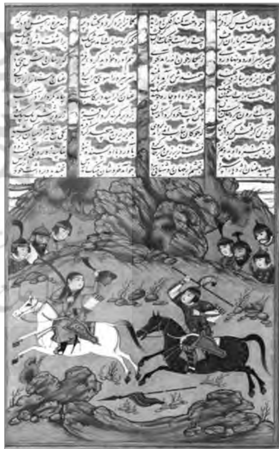
تصویر ۲: نگاره با کادر بسته، مجلس هجدهم؛ نبرد سهراب با گردآفرید، به‌احتمال محمد یوسف، ۱۴۵. ۲۷۰ mm (شاهنامه رشید، کاخ گلستان)، (آرشیو نسخ خطی کاخ گلستان)