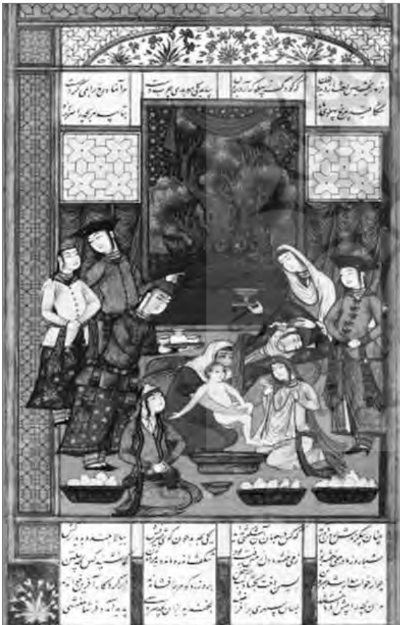
تصویر ۹: مجلس هشتم: تولد رستم، به احتمال محمد قاسم، mm ۱۸۰ ۳۲۳ (شاهنامه رشیدا، کاخ گلستان)، (آرشیو نسخ خطی کاخ گلستان)

ایرانی رنگ‌های تیره و روشن به‌صورت نیم‌سایه‌ها، روی هم و یا کنار هم در بیشتر بخش‌های تصویر دیده می‌شود و این شیوه اجرایی به نوعی به سایه‌پردازی و حجم‌گرایی نزدیک شده است. کنار تخته‌سنگ‌ها، در پایین درختان، بته‌های گل، زیر پای پیکره‌ها و حیوانات در کناره فرم‌ها و مابین خطوط، تجمع این سایه‌پردازی‌ها بیشتر است؛ به‌گونه‌ای که سایه اشیا یا پیکره‌ها را نشان می‌دهد. موضوع اصلی نگاره‌ها انسان است، گل‌ها و بته‌ها نسبتاً در همه جای نگاره به یک اندازه پرداخت شده‌اند؛ به‌ویژه در زیر و در کناره خطوط کناره‌نمای آن‌ها تجمع ضربات قلم و پردازها بیشتر است؛ در نتیجه تا حدودی حجم و سایه، زیر بته‌ها به‌وجود آمده است (نک. تصویرهای ۵،