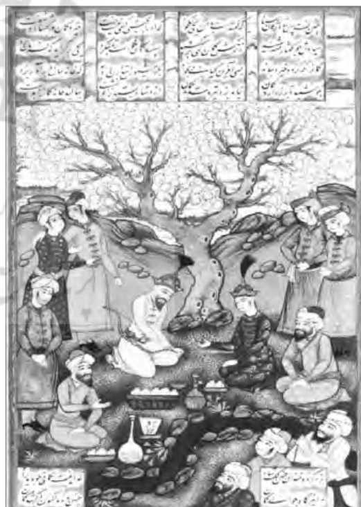
تصویر ۱۶: مجلس بیست و پنجم: آزمون کمان سیاوش به وسیله افراسیاب، احتمالاً محمد یوسف، mm ۱۴۵. ۲۶۸ (شاهنامه رشید، کاخ گلستان)، (آرشیو نسخ خطی کاخ گلستان)