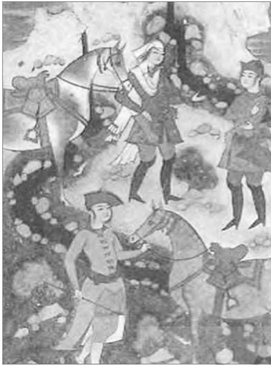
تصویر ۱۳: دیدار خسرو و شیرین در کوهستان، محمد قاسم، نیمه سده ۱۱ق (کتابخانه چستر بیٹی دابلین)، (Les Peintures De Shah ABBASI, 1964)