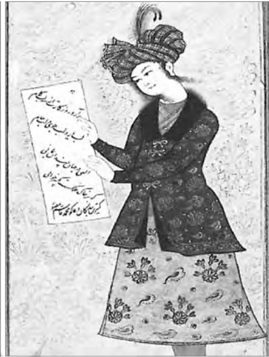
تصویر ۱۲: مرد جوان با یک برگ کاغذ بزرگ با قطعه شعری روی آن (با رقم کمترین بندگان دعاگو محمد قاسم مصور (مجموعه پرنس کاترین آفاخان)، (The Windsor Shahnama, 2007)