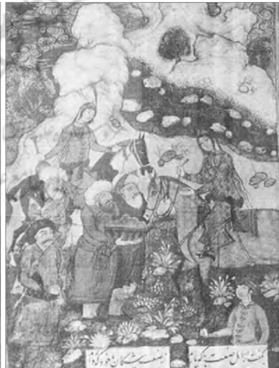
تصویر ۱۴: دیدار شیرین و فرهاد در بیستون، اثر محمد قاسم، منظومه وحشی بافقی، اواخر نیمه اول سده ۱۱ق (کتابخانه چستر بیٹی دابلین)، (Les Peintures De Shah ABBASI, 1964)