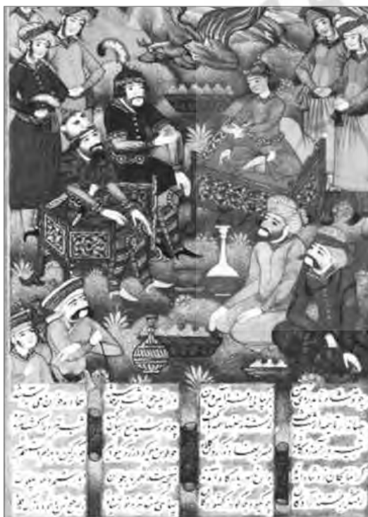
تصویر ۱۷: مجلس سی و هشتم: مجلس کبخسرو و رستم و دیگر سران ایران، به احتمال محمد یوسف mm ۱۴۴. ۲۶۸ (شاهنامه رشید، کاخ گلستان، آرشیو نسخ خطی کاخ گلستان)

کبکی نیز در کتاب عصر طلایی می‌نویسد: «محمد قاسم در اجرا و تهیه نسخه خطی سوز و گداز و شاهنامه