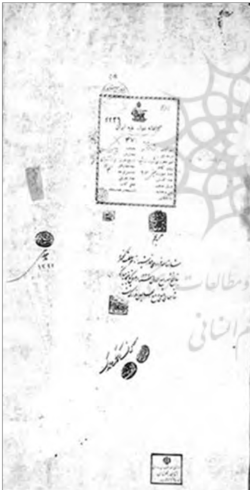
تصویر ۱: صفحه آستر بدرقه شاهنامه رشیدا، بخش نسخ خطی، کاخ موزه گلستان، تهران

در این دوره، هنر و نقاشی از عالم خیال و فضای معنوی دور و به عالم واقع و تعقل نزدیک شد. روابط با