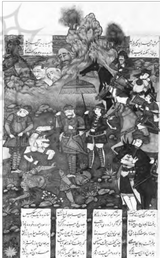
تصویر ۱۰: مجلس اول: کشته شدن دیوها به دست هوشنگ، به احتمال محمد قاسم، mm ۱۶۳. ۲۷۰ (شاهنامه رشیدا، کاخ گلستان)، (آرشیو نسخ خطی کاخ گلستان)