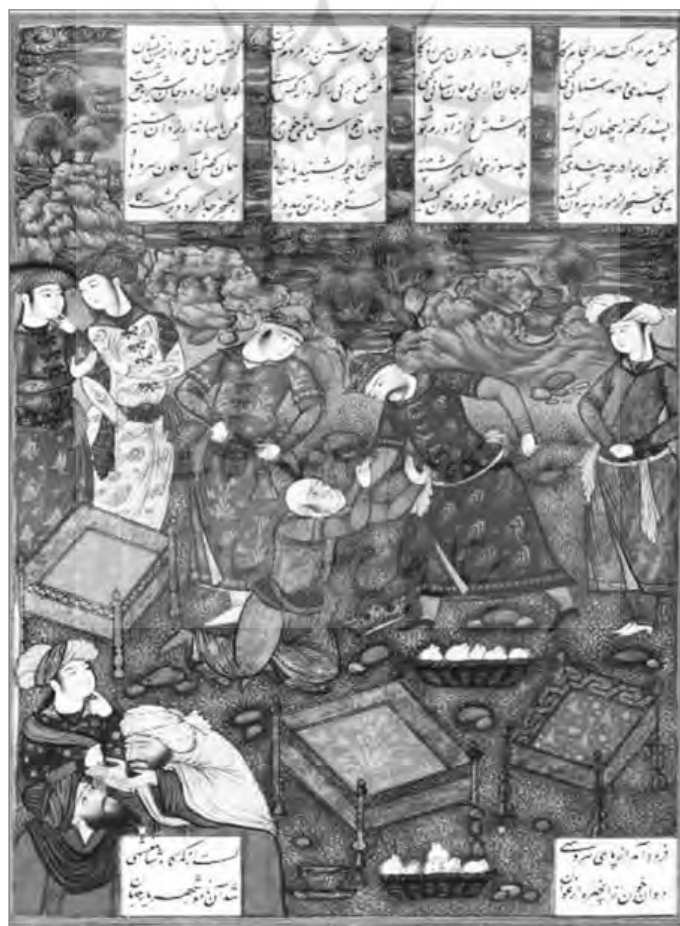
تصویر ۷: مجلس سوم: کشته شدن ایرج به دست برادران، به احتمال محمد قاسم، ۲۸۰ × ۱۸۷ mm (شاهنامه رشید، کاخ گلستان، آرشیو نسخ خطی کاخ گلستان)

در شاهنامه رشید، ده روایت الحاقی به شاهنامه فردوسی وجود دارد. این امر نشان می‌دهد که سفارش‌دهنده و یا حامی شاهنامه رشید با پرداختن به داستان‌های الحاقی یا داستان‌های برزنامه، به شرح حال و جنگ‌آوری‌ها و افتخارات خود اشاره کرده است. نگاره‌ها کل صفحه تصویر را اشغال کرده‌اند و کتیبه‌هایی از متن داستان به سیاقی که از مکتب تبریز صفوی آغاز شده و در مکتب اصفهان نیز مرسوم بوده، در چارچوب تصویر قرار گرفته و اغلب بیت‌ها در پایین و بالای صفحه تنظیم شده است. در بیشتر موارد شیوه رنگ‌گذاری، ترکیبی از رنگ‌های غلیظ (جسمی) در کنار رنگ‌های رقیق (روحی) است. به همین دلیل در بخش‌هایی، رنگ سطح کاغذ را پوشانده است. رنگ‌های آبی و سبز تیره و روشن، قرمزها و صورتی‌های متنوع و قرمز هندی در نگاره‌ها دیده می‌شود که در آثار مکتب اصفهان و بعد از آن در نتیجه تأثیرپذیری و ارتباط با هند بیشتر می‌شود. نقطه‌پردازی‌های درشت و آبدار در زمینه‌ها و به‌طور اخص درختان و طبیعت‌سازی (برای ایجاد سایه‌روشن) به کار رفته است. نمایش عمق در آسمان از ابرهای حلقوی با خطوط افقی اجرا شده است. این تأثیرپذیری را در نقاشی‌های بسیاری از هنرمندان مکتب اصفهان همچون محمد قاسم و محمد یوسف می‌توان دید (تصویرهای ۴-۷). در این نگاره‌ها (پرسپکتیو خطی) و میل به نمایش عمیق و تقلید برخی ویژگی‌های ناقص هنر واقع‌نمایی غربی، در قسمت‌هایی از نگاره‌ها تأثیر گذاشته است و این امر میراث فرنگی‌سازی و از ویژگی‌های نگارگری نیمه