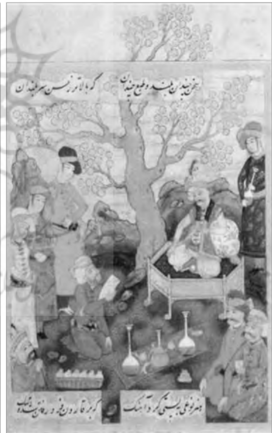
تصویر ۴: نگاره سخن چندان بلند و طبع چندان، اثر محمد یوسف، سده ۱۱ق (موزه رضا عباسی، آرشیو موزه رضا عباسی)