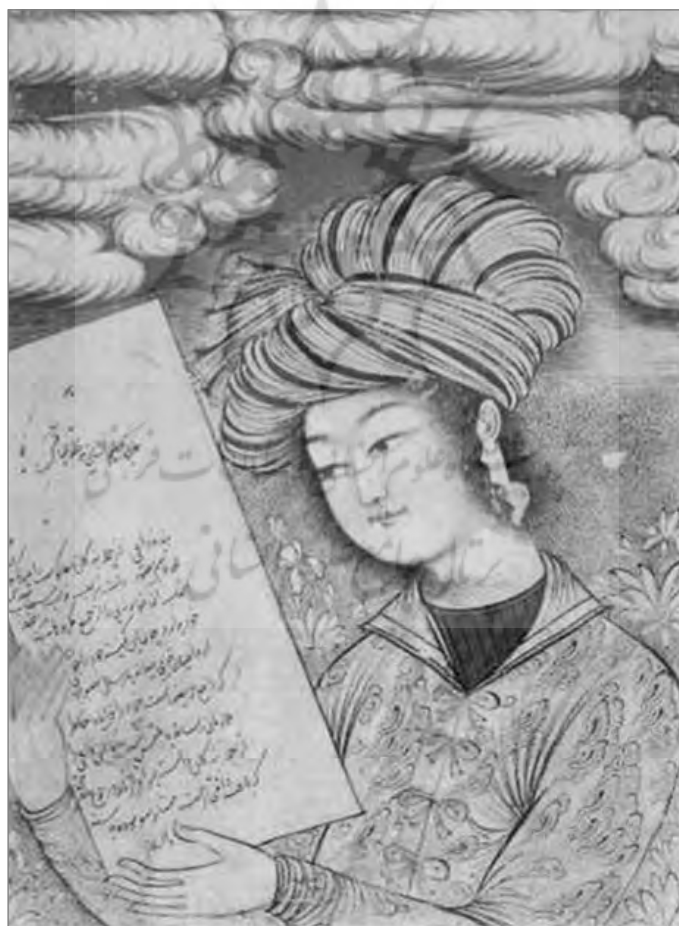
تصویر: نگاره مرد جوان با یک برگه نوشته (موزه کاخ گلستان)، قرن ۱۱ ه.ق، محمد قاسم (آرشیو نسخ خطی کاخ گلستان)

بسیاری از موضوع‌های نگاره‌های شاهنامه رشیدا داستان‌های شاهنامه را بیان می‌کنند؛ ولی درحقیقت