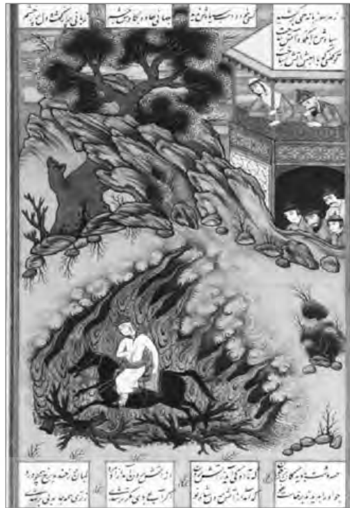
تصویر ۱۸: گذشتن سیاوش از آتش، اثر محمد یوسف، شاهنامه فرچقای خان، ۱۰۵۸ ق (قصر وینزور انگلیس، آرشیو نسخ خطی کاخ گلستان)

(Melville & Brend, 2010: 207) (تصویرهای ۱۰، ۱۱ و ۱۳).