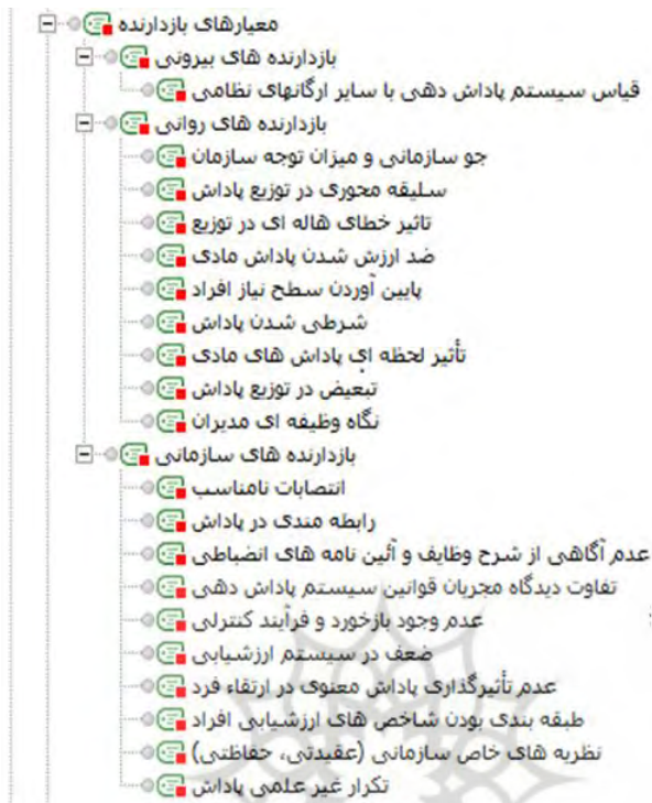
شکل ۳: مضامین پایه، سازمان دهنده و فراگیر در معیارهای بازدارنده

منظور از عوامل مؤثر بر توزیع پاداش، عواملی است که به نظر خبرگان و کارشناسان باید در نظام پاداش دهی در نظر گرفته شود. در این پژوهش با اشاره به این ابعاد، سعی شده است به میزان اهمیت آن‌ها اشاره شود. علاوه بر این باید به این امر توجه کرد که ممکن است بعضی از این مقولات در سازمان موجود و تعریف شده باشند اما به آن‌ها توجه لازم نمی‌شود.