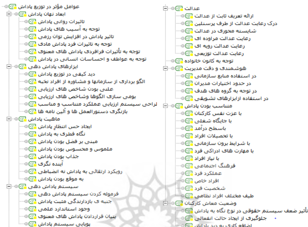
شکل ۴: مضامین پایه، سازمان دهنده و فراگیر در عوامل مؤثر

با توجه به داده‌های به‌دست آمده از مصاحبه‌های اکتشافی نشان داده شد که علاوه بر ایجاد انگیزش، در صورت توزیع صحیح پاداش، می‌توان نتایج و پیامدهای دیگری هم انتظار داشت. به این صورت که اگر نظام پاداش‌دهی به صورت صحیح و عادلانه انجام شود می‌تواند باعث افزایش ارتقای توان رزمی کارکنان شود؛ برای فرد امنیت شغلی بیشتری ایجاد کند؛ عملکرد نظام به درستی انجام شود و باعث ارتقای شغلی، پویایی شغلی و نوآوری شود.