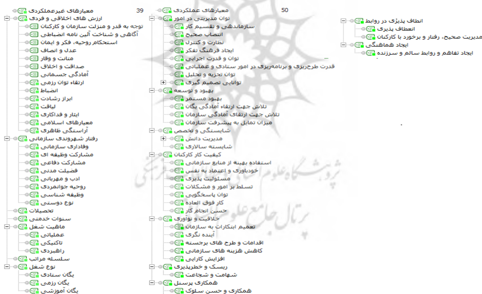
شکل ۲: مضامین پایه، سازمان دهنده و فراگیر در معیارهای زمینه ساز در الگوی ارائه شده

آن‌ها را در نظر می‌گیرد. در این پژوهش این ابعاد به دو دسته‌ی کلی معیارهای عملکردی و غیرعملکردی تقسیم می‌کند. بررسی اسناد و مطالعات قرارگاه پدافند هوایی خاتم‌الانبیاء (ع) آجا بیشتر برای شناسایی معیارهای زمینه ساز انجام شده است، از آن جهت که بر اساس نظام‌های مدیریت منابع انسانی نظام پاداش‌دهی از نظام ارزیابی عملکرد سازمان تأثیر می‌گیرد و ابزاری است برای توزیع عادلانه پاداش در سازمان؛ از این جهت ابعاد به‌دست آمده در دسته بندی معیارهای عملکردی، ابعادی هستند که به منظور ارزیابی عملکرد کارکنان می‌تواند به کار گرفته شود. ابعاد به‌دست آمده در دسته‌بندی معیارهای غیرعملکردی بیشتر مقولاتی هستند که برای سازمان از اهمیت بالایی برخوردار است و از آن جهت که ماهیتی غیرعملکردی دارد، اما برای ارزیابی و ارزشیابی عملکرد کارکنان آن‌ها را مدنظر قرار می‌دهد. در این پژوهش سعی شده است که به آن‌ها، ضمن شناسایی‌شان یک نظم مناسب داده شود. با توجه به الگوی ارائه شده و نتایج به‌دست آمده معیارهای زمینه ساز به شرح شکل ۲ است.