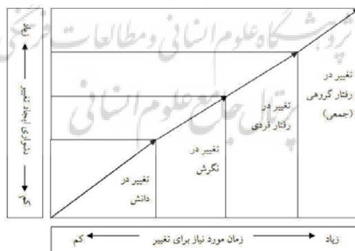
نمودار ۱: مقایسه سطوح مختلف تغییر از حیث میزان دشواری و زمان مورد

۱. دانش افراد را می‌توان از طریق آموزش‌ها و تجارب مستقیم و غیرمستقیم تغییر داد؛ بنابراین، برای افزایش مشارکت والدین در جلسات انجمن، می‌توان از مدل دانشمندان علوم رفتاری، مطابق نمودار ۱ استفاده کرد و رفتارهای مطلوب را در افراد و سازمان‌های هدف بدین ترتیب نهادینه ساخت.