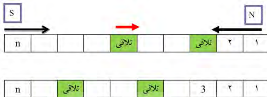
شکل (۱) - جابه‌جایی بلاک تلاقی

ترکیب پارامتر ۱۰ مساله حل گردید. بهترین جواب در این مدل با ضریب انجماد برابر با ۰/۹۵ و تعداد تکرارهای داخلی (در هر دما) و خارجی (تعداد دفعات کاهش دما) ۵۰ بدست آمده است.