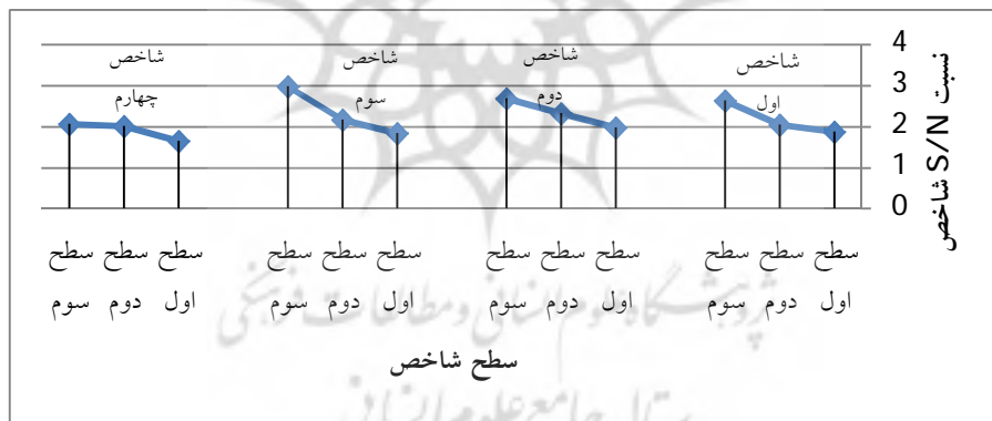
شکل 2 نمودار وضعیت نسبت S/N شاخص‌های بعد دانش شغلی و مهارت‌ها

هرچند در مرحله قبل، شاخص‌های با اهمیت در هر بعد مشخص شده و به تأیید خبرگان نیز رسید، اما در این قسمت سعی می‌شود تا با استفاده از نرم‌افزار کوالیتک، نتایج به دست آمده برای اوزان شاخص‌ها تأیید بیشتری پیدا کند. برای این کار لازم است تا نمودار نسبت S/N شاخص‌های هر بعد که یکی از خروجی‌های نرم‌افزار کوالیتک است، بررسی شود؛ برای مثال در شکل 2، خروجی نرم‌افزار کوالیتک در مورد نسبت S/N چهار شاخص بعد دانش شغلی و مهارت‌ها نشان داده شده است.