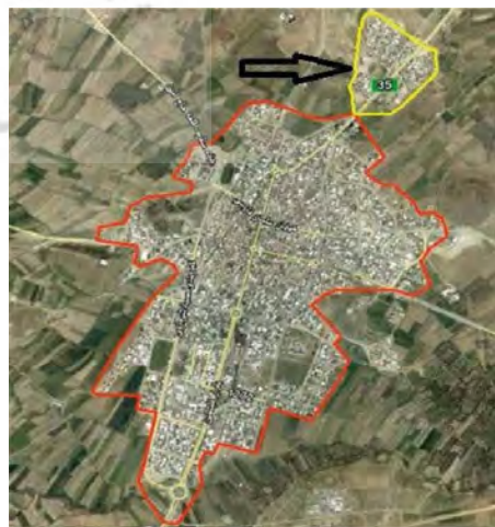
نگاره ۱: موقعیت شهرک حاشیه‌نشین شهدا نسبت به شهر

شهرستان سنقر و کلیائی یکی از شهرستان‌های استان مرزی کرمانشاه می‌باشد که با مساحتی حدود ۲۲۴۲ کیلومترمربع در ۳۶ درجه و ۲۲ دقیقه عرض شمالی و ۴۸ درجه و ۱۳ دقیقه طول شرقی در غرب کشور ایران واقع گردیده است. شهرک شهدا بر روی تپه‌های حاشیه شمال شرقی شهر سنقر با جهت شیب شمال شرقی - جنوب غربی قرار دارد. هسته اولیه سکونتگاه شهرک شهدا متعلق به حدود ۳۰ سال قبل است. برخی از ساکنین این شهرک مهاجران روستایی هستند به گونه‌ای که طبق آمار رسمی سال ۱۳۹۰، ۵۹/۴ درصد آن مهاجران روستایی می‌باشند که برای کارگری در شهر سنقر به این شهرک آمده‌اند. شهرک شهدا در سال ۱۳۹۰ حدود ۵۵۶۰ نفر جمعیت داشته است. مالکیت ۲۶۷۶ درصد از مسکن در شهرک شهدا دارای سند رسمی، ۶۵/۷ درصد به صورت قولنامه‌ای و ۶۷ درصد نیز به صورت تصرف است (سرشماری نفوس و مسکن، ۱۳۹۰) درآمد ماهیانه خانوار نشان می‌دهد که در حدود ۸۰٪ از خانوارهای ساکن، از سطح درآمدی سه میلیون ریال و پائین‌تر برخوردار هستند. نرخ بیکاری و بار تکفل خانوار، بسیار بالاتر از میانگین استان است به طوری که بار تکفل خانوار در شهرک شهدا ۵/۷۳٪ و از میانگین نقاط شهری استان و شهر سنقر بالاتر است. (مهندسین مشاور آرمان شهر، ۱۹)