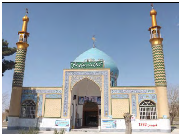
شکل ۲- آستانه متبرکه امامزاده ابراهیم بن عباس (ع) در