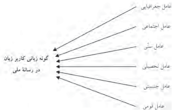
نمودار شماره ۱ - تنوع زبانی برحسب کاربرد