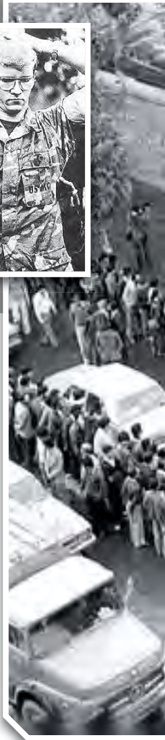
▷ اقامه نماز جماعت دانشجویان پیرو خط امام در حیاط لانه جاسوسی پس از تسخیر آن