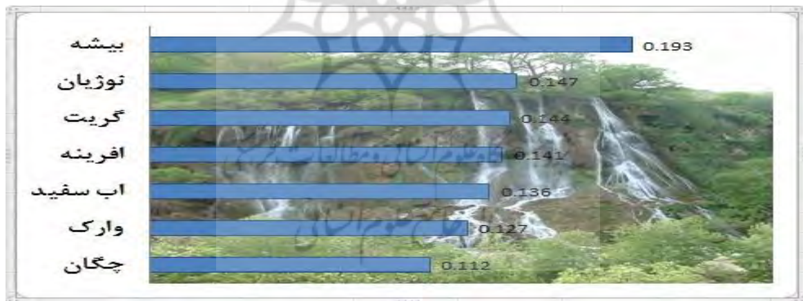
شکل ۲. اولویت‌های آبخازهای هفت گانه استان لرستان