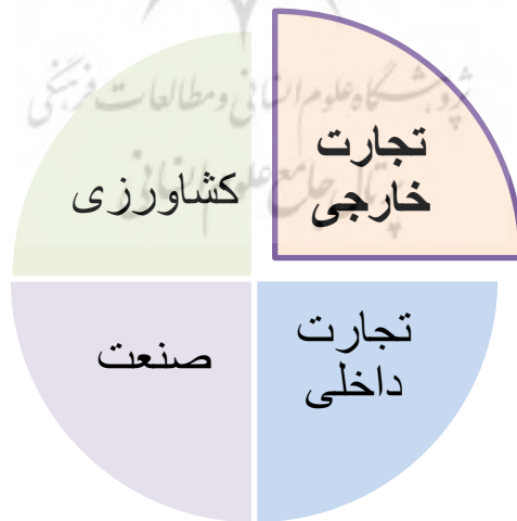
شکل ۲: سیستم اقتصادی ایران در عصر زنده

سیستم تجارت ایران در دوره‌ی زنده، بخشی از نظام اقتصادی این دوره است. بخش‌های مختلف سیستم اقتصادی و تجاری ایران در عهد زنده (در اینجا بیشتر بخش تجارت خارجی آن مورد توجه است) در کنش و ارتباط متقابل با هم بودند (شکل ۲).