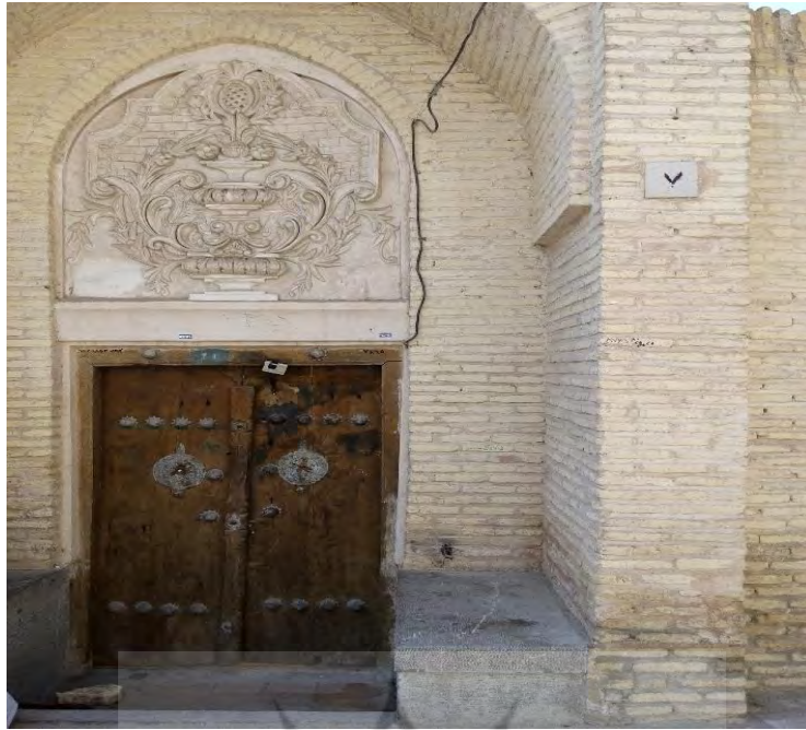
تصویر ۱: درب ورودی تکیه پانچار

جسد خواجه نظام‌الملک را در همین نظامیه، که به دستور خودش بنا شده، دفن کردند. برخی عقیده دارند که پیش از سال ۵۱۱ هجری پیکر او را از اصفهان به نیشابور برده‌اند. (کسای۳: ۱۳۶۳: ۴۳) گویند به فاصله کم‌تر از یک ماه ملک‌شاه نیز مسموم و کشته شد. نعش ملک‌شاه را به اصفهان آورده و در مدرسه‌ای، معروف به مدرسه ملک‌شاهی، که به دستور خواجه نظام‌الملک ساخته شده بود، دفن کردند. پس از این دو حادثه بزرگ، دولت سلاجقه رو به افول نهاد. امیر معزی ابیاتی در تأسف بر از دست رفتن خواجه و شاه دارد: دستور و شهنشه ز جهان رایت خویش بردند و مصیبتی نیامد زین بیش (امیر معزی، ص ۸۱۳-۸۱۴) خواجه نظام‌الملک، در طول وزارت بیش از بیست ساله خود، مدارس معتبری به نام «نظامیه»، در شهرهای گوناگون، بنا کرد. او برای رونق و آبادانی آن از اموال شخصی خود نیز هزینه کرده بود و به مدرستان و محصلان آن پول می‌پرداخت. سعدی در نظامیه بغداد تحصیل علم کرد و درس گفت، آنچنان که خود گفته است: مرا در نظامیه ادرار بود شب و روز تلقین و تکرار بود (سعدی، ۱۳۷۹: ۳۵۰) بنای آن به دستور نظام‌الملک ساخته شد. وی، همچنین، دستور ساختن نظامیه در اصفهان و شهرهای دیگر چون بلخ، هرات، مرو را صادر کرد، که این نظامیه‌ها از نام خود او گرفته شده‌است. از آنجا که سلاجقه حکومت وسیعی داشتند، ناچار از داشتن سپاه برای حفظ و مراقبت از مرزهای این پادشاهی وسیع بودند؛ بنابراین، خواجه افراد زیادی را تربیت می‌کرد تا به عنوان نظامی از کشور صیانت و دست‌اجنبی را از این فرمانروایی گسترده کوتاه کنند. همین سبب شد تا بدخواهان خواجه