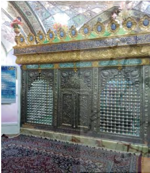
تصویر ۳: آرامگاه صاحب بن عبّاد در سمت چپ میدان میر سابق

اصلی شهر نزدیک می‌شویم، بناها خاص تر می‌شود. مثلاً بازاری که فرش فروشان، فرش‌های نفیس خود را به آنجا آورده و می‌فروختند یا دارالبطیخ که خربزه فروشان محصولات کشاورزی خود را عرضه می‌کردند. با توجه به بطیخ، که خربزه فروش معنی شده، این ناحیه، محل فروش خربزه بوده‌است، که البته بعدها محل دفن بزرگان و شاهان شده و با موضوع عنوان شده به معنی خربزه فروش منافاتی ندارد. منطقه دردشت که شهرت و قدمت آن به پیش از روزگار سلجوقیان می‌رسد؛ سمت دیگر میدان میر (غلوم بیگ، ۱۳۸۵: ۲۸) قرار دارد. به طرف طوقچی فعلی قبر صاحب بن عبّاد واقع شده است.