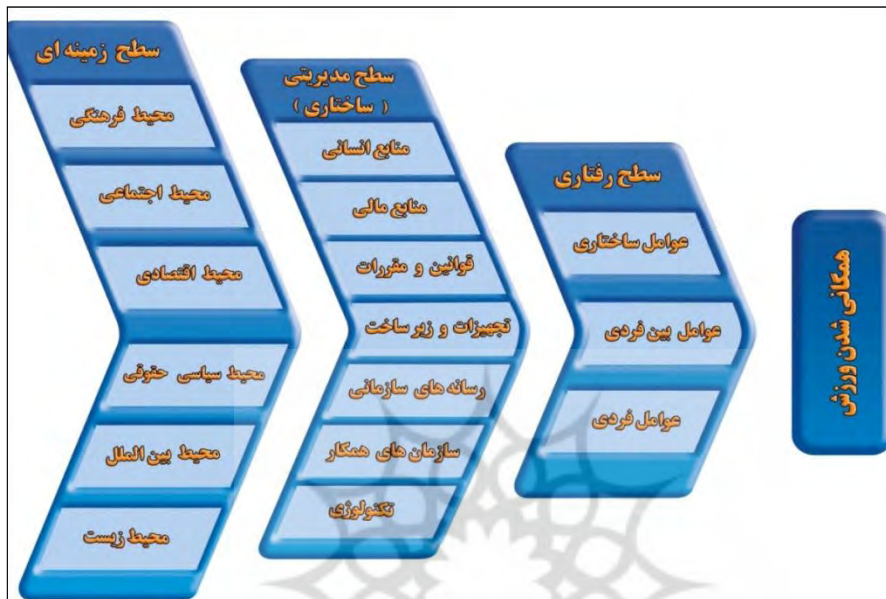
شکل شماره ۲- مدل ورزش همگانی ایران