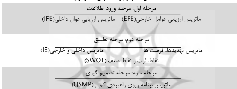
شکل ۲- چارچوب تدوین استراتژی

در این تحقیق از آمار توصیفی و استنباطی استفاده شده است. در بخش آمار استنباطی به منظور رتبه بندی قوت‌ها، ضعف‌ها، فرصت‌ها، تهدیدها، از آزمون رتبه‌ای «فریدمن» استفاده گردید.