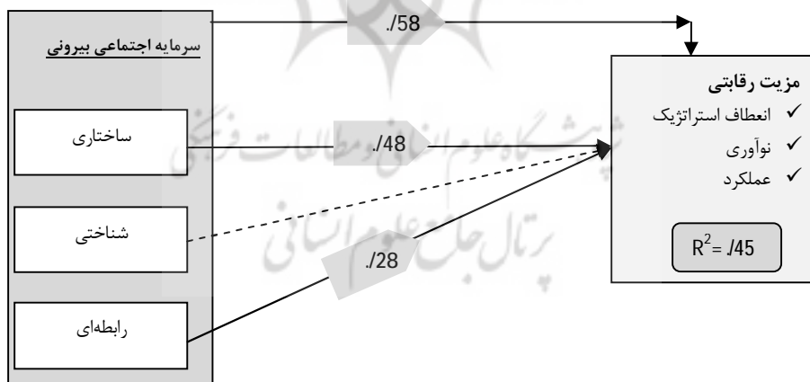
شکل 2 مدل نهایی تحلیل مسیر تحقیق بر اساس مؤلفه ها

اطمینان 99 درصدی این رقم دارد. علاوه بر این ضریب تعیین 0/45 نیز از تغییر پذیری 45 درصدی مزیت رقابتی با تغییرات سرمایه اجتماعی بیرونی، در صنعت رنگ و رزین دارد. از نظر مدل سازی رقم 0/45 برای ضریب تشخیص متغیر درونزا که فقط دارای یک مؤلفه برونزا (سرمایه اجتماعی بیرونی) می باشد بین بازه متوسط و قابل توجه برای مدل محسوب می گردد. بر اساس مباحث موجود در مورد ضریب تعیین، 0/19 ضعیف، 0/33 متوسط و 0/67 قابل توجه محسوب می گردد [1، ص 167 و 168]. در بین مؤلفه های سرمایه اجتماعی، بعد ساختاری و رابطه ای با ضریب مسیر (0/48) و 0/28 تأثیر معنادار (ضریب معناداری 4/7 و 2/8) و قابل قبولی روی مزیت رقابتی دارند. با این وجود بعد شناختی جایگاه مناسبی نداشته و حتی خود را با تأثیر منفی نشان داده است که می تواند از مدل نهایی حذف گردد. مدل نهایی تحقیق را می توان در مؤلفه های اصلی و ابعاد سرمایه اجتماعی در شکل (2) دید. قابل ذکر است که علیرغم اینکه مدل PLS فاقد معیار بهینه سازی شده کلی می باشد، با اینحال از ارقام سه شاخص اشتراک (0/653)، افزونگی (0/483) و نیکویی برازش نسبی (0/908) به عنوان شاخص کیفیت این مدل استفاده می گردد. که همه این موارد شاخص توصیفی می باشند و بخصوص برای دو شاخص اولی معیار خاصی ذکر نشده است. با اینحال نیکویی برازش نسبی برابر و بیشتر از 9/ می تواند نشان از مطلوبیت مدل باشد [1، ص 175-180].