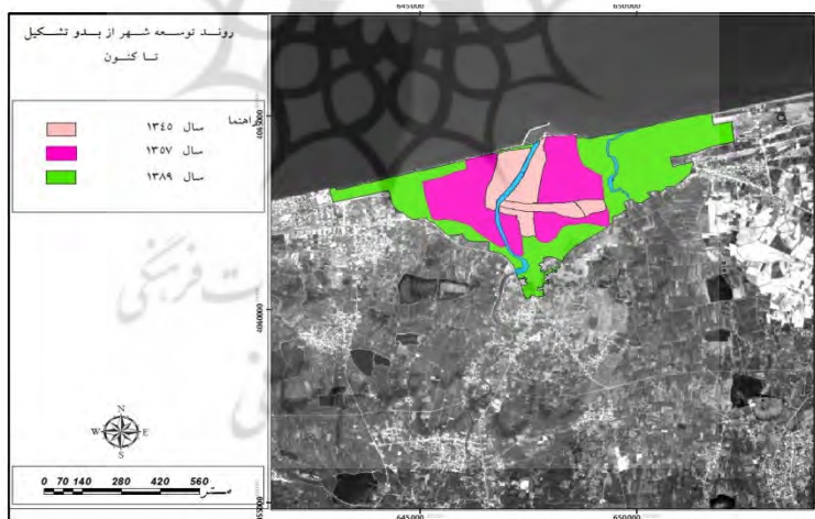
شکل ۲: روند توسعه شهر از بدو تشکیل تا زمان حاضر

مرحله اول از بدو تأسیس تا سال ۱۳۴۵: روند شکل‌گیری و الگوی شهر بابلسر در چند دهه گذشته بیانگر آن است که هسته اولیه شهر بابلسر در حدود ۹ قرن پیش در جوار امامزاده-ابراهیم، پیش از احداث شهر و بندر شکل گرفت ب- مرحله دوم از سال ۱۳۴۵ تا ۱۳۵۷ (در این دوره با اولین طرح جامع شهر، محدوده شهر گسترش یافت) ج- مرحله سوم از سال ۱۳۵۷ تا حال حاضر (این دوره هم‌زمان است با پیروزی انقلاب و جنگ تحمیلی که در این دوره شهر با شتاب بیشتری به گسترش خود ادامه داد) (شکل ۲).