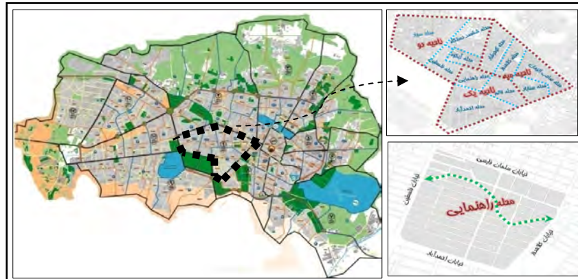
شکل ۱: موقعیت محدوده مورد مطالعه در شهر مشهد