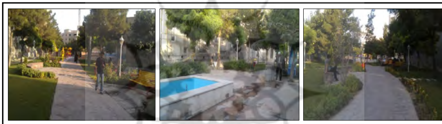
شکل ۲: نمایی از پیاده‌راه قره‌خان شهر مشهد