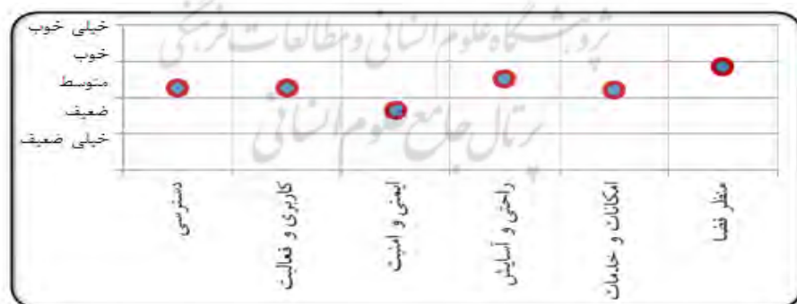
شکل ۴: برآیند پاسخگویی افراد به شاخص‌های سنجش کیفیت محیطی

مطابق جدول ۳، بیش از ۵۰ درصد پرسش‌شوندگان از وضعیت دسترسی به مسیر، کاربری‌ها و فعالیت‌های موجود در آن، راحتی مسیر، امکانات و خدمات موجود در آن و منظر فضا، رضایت داشته‌اند. چنان‌که هر یک از شاخص‌ها در نظرسنجی صورت گرفته، به ترتیب امتیازهای ۳/۲۸، ۳/۲۷، ۳/۵۱، ۳/۲۱ و ۳/۸۷ را از طیف پنج‌قسمتی لیکرت کسب کرده‌اند. این در حالی است که نزدیک به ۵۰ درصد آن‌ها وضعیت ایمنی و امنیت مسیر را نامطلوب دانسته‌اند و از تاریکی و خلوت بودن مسیر در شب، عدم نظارت مسئولین و همچنین ایمنی ضعیف آن، به‌خصوص برای کودکان و سالمندان، اظهار نارضایتی کرده‌اند. به‌طوری‌که کیفیت این شاخص، در نظرسنجی صورت گرفته، از طریق طیف لیکرت، با امتیاز ۲/۶۵، کمتر از حد متوسط و به‌طورنسبی، ضعیف، ارزیابی شده است (شکل ۴).