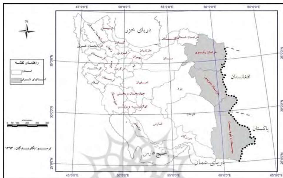
شکل (۱) مرزهای شرقی کشور در همسایگی کشورهای افغانستان و پاکستان

که با وزن‌دهی به موارد مورد نظر به تکمیل ماتریس سوات منجر شد و در ادامه، راهبردهای مناسب برای آمایش مناطق مرزی شرق کشور ارائه گردید. در نهایت نیز برای مشخص شدن اولویت راهبردها از ماتریس برنامه‌ریزی استراتژیک کمی ۲ استفاده شد و براساس آن اولویت هر یک از راهبردها مشخص گردید.