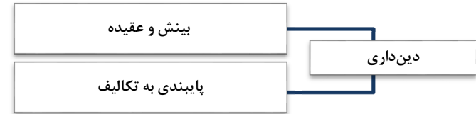
نمودار ۲: شاخص‌های معیار دین‌داری

معیار دین‌داری با در نظر گرفتن دو شاخص بینش و عقیده صحیح و تکلیف‌مداری برای آن، مشتمل بر جنبه‌های گوناگون پیشرفت روحی و جسمی، دنیایی و آخرتی انسان است؛ زیرا در شاخص تکلیف‌مداری نمازهای چون نماز و روزه مطرح است که بیشتر جنبه رشد و پرورش روح را برای انسان دارد و نمازهای چون خمس و زکات در آن جنبه پیشرفت اقتصادی انسان را در نظر می‌گیرد، امر به معروف و نهی از منکر نیز جنبه اجتماعی دارد، در عبادتی مانند حج به همه ابعاد مزبور توجه می‌شود.