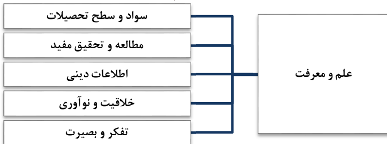
نمودار ۳: شاخص‌های معیار علم و معرفت

برای ارزیابی و سنجش میزان علم و معرفت افراد جامعه می‌توان از پنج شاخص سواد و سطح تحصیلات، مطالعه و تحقیق مفید، تفکر و بصیرت و خلاقیت و نوآوری بهره برد. تمایز شاخص مطرح‌شده با نظیر این شاخص در توسعه انسانی غرب (نرخ باسوادی) اضافه شدن معرفت است؛ زیرا از نظر اسلام علم و سواد و همچنین نتایج آن زمانی برای سعادت انسان سودمند است که مقدمه و ابزاری برای کسب معرفت باشد.