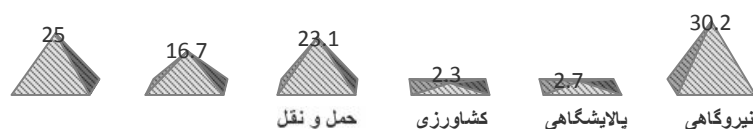
نمودار (۱) سهم هریک از بخشهای مصرف کننده انرژی در انتشار کربن دی اکسید در سال ۱۳۹۰

می‌شود. بیشترین میزان انتشار کربن دی اکسید از نیروگاه گازی و بخار است که به ترتیب ۲۴/۵ و ۳۹/۹ درصد از تولید برق کشور از این نیروگاه‌ها بوده است. نیروگاه‌های سیکل ترکیبی نیز ۳۰/۳ در تولید برق سهم داشته‌اند [۲].