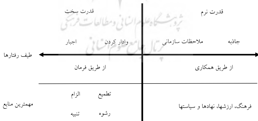
نمودار ۱- طیف قدرت از سخت تا نرم

خارجی (Nye, 2005). فرهنگ، مجموعه‌ای از ارزش‌ها و رویه‌هایی است که به جامعه معنا می‌بخشد. زمانی که فرهنگ یک کشور، ارزش‌های جهان‌شمول را دربر می‌گیرد و سیاست‌های آن، ارزش‌ها و منافع را ارتقا می‌بخشد که دیگران نیز در آن سهیم هستند، به دلیل جاذبه‌آفرینی، احتمال دستیابی به نتایج مطلوب برای آن کشور فراهم می‌شود. سیاست‌های داخلی و خارجی دولت‌ها نیز می‌تواند بر قدرت نرم تأثیر بگذارد. سیاست‌های دولت اعم از داخلی و خارجی که ریاکارانه، متکبرانه، بی‌تفاوت نسبت به نظر دیگران یا مبتنی بر رویکرد کوتاه‌نظرانه نسبت به منافع جهانی باشند، منجر به تضعیف قدرت نرم یک کشور خواهند شد؛ درحالی‌که تلاش برای ارتقای حقوق بشر و دموکراسی عامل مهمی در تقویت نفوذ خواهد بود. می‌توان چنین استدلال کرد ارزش‌هایی که یک دولت در رفتار داخلی خود، در نهادهای بین‌المللی و سیاست‌های خارجی مورد حمایت قرار می‌دهد، اولویت‌های دیگران را شدیداً متأثر می‌سازد. نهادها نیز می‌توانند قدرت نرم یک کشور را تقویت کنند. ارتباط‌های فردی، مجرای مهم دیگری برای اعمال قدرت نرم هستند (هرسیج و تویسرکانی، ۱۳۸۹). بر این اساس، قدرت نرم - چیزی فراتر از قدرت فرهنگی است و دیگر اینکه به اندازه قدرت سخت، وابسته به دولت نیست و تنها در چنبره حکومت محبوس نبوده (Nye, 2002) و فرهنگ عمومی جامعه تأثیر فراوانی بر آن دارد؛ بنابراین، از مهم‌ترین تمایزات قدرت سخت و نرم، مردمی بودن و غیررسمی قدرت نرم است.