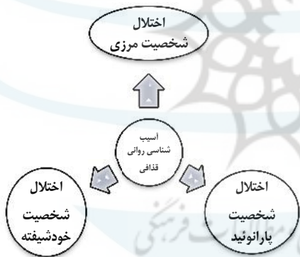
شکل شماره (۱). آسیب‌شناسی روانی قذافی

با وجود این، از نظر تحلیل روانشناختی، تشخیص‌گذاری متمایز اختلالات شخصیت فوق با تکیه بر بیوگرافی و مطالعه مصاحبه‌های مطبوعاتی اقدام چندان دقیقی نیست، اما بهتر است همه این نشانگان در یک دسته به طور تجمعی نگریسته شود. در هر صورت باید توجه داشت یک میانجیگر