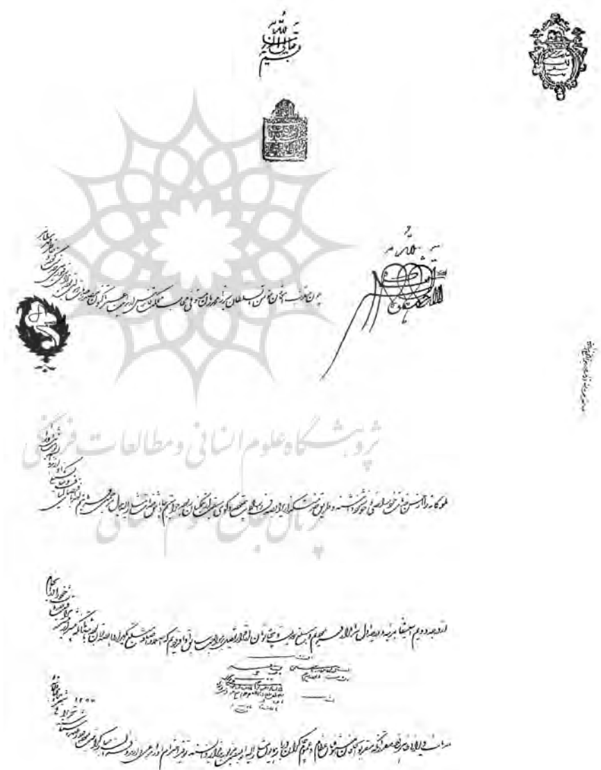
تصویر ۱: سند «فرمان» متعلق به دورهٔ قاجار (قائم‌مقامی ۱۳۵۰، ۲۱۷)

اسناد تاریخی و معماری ایران برقرار است. در این میان، شماری از اسناد دارای اطلاعات معماریانه مهمی‌اند: در فرمان‌های حکومتی نکاتی دربارهٔ وضعیت شهرها و بناها و تغییراتشان در طول زمان، در نامه‌ها و گزارش‌های اداری در مورد وضعیت املاک شاهان و درباریان، در اسناد خرید و فروش و مدارکی از این دست، اطلاعات دقیقی دربارهٔ مکان جغرافیایی، مجاوران ملک معامله‌شده و ویژگی‌های کالبدی مانند ابعاد و حدود اربعه، و در وقف‌نامه‌ها اطلاعات مفصلی در مقیاس‌های مختلف از شهر تا اجزای بناها به چشم می‌خورد. به نظر می‌رسد که وقف‌نامه‌ها بهترین اسناد برای پژوهش در معماری ایران باشند؛ زیرا افزون بر نمایاندن احوال جامعهٔ زمان خود، حاوی داده‌های معماریانهٔ فراوان‌تری‌اند که از مهمترینشان اینهاست: نام شهرها و آبادی‌ها، تاریخ دقیق ساخت اثر، نام فضاها، جزئیات کالبدی و فنی، هنرهای و مشاغل وابسته به معماری و حتی اصطلاحات معماریانه.