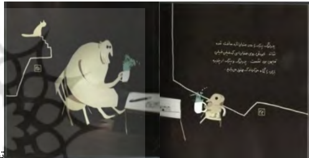
تصویر (۱۰)، صفحات ۳۴ و ۳۵