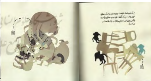
تصویر (۵)، صفحات ۲۴ و ۲۵