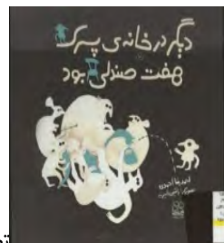
تصویر (۱)، طرح روی جلد

داستان «دیگر در خانه پسرک هفت صندلی بود»، نوشته: احمدرضا احمدی، تصویرگر: راشین خیریه، نشر چشمه، ۱۳۸۸، تهران، گروه سنی ب.