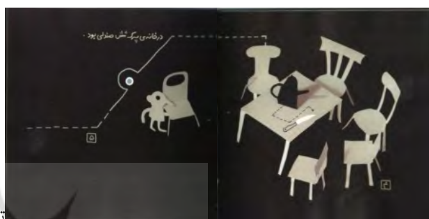
تصویر (۲)، صفحات ۴ و ۵