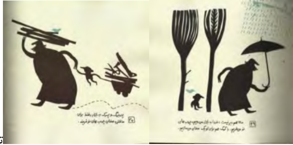
تصویر (۷) و (۸)، صفحات ۲۹ و ۳۰