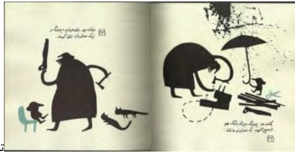
تصویر (۹)، صفحات ۳۲ و ۳۳