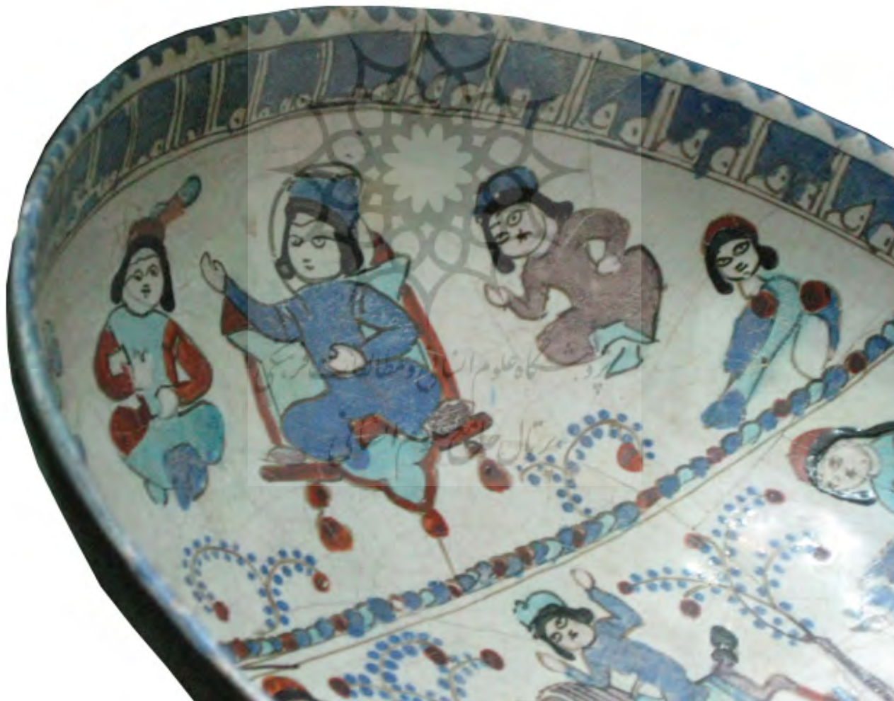
تصویر ۱. تخت سلجوقی منقوش بر کاسه مینایی، مأخذ: موزه رضا عباسی.

اما نکته قابل توجه علاوه بر اشکال، غنای شگفت‌انگیز طرح‌های تزئینی و نقشمایه‌های پیکره‌ای آن است. چنین می‌نماید که شکوفایی و کاربرد تصویر پیکره‌ای و نمادین در تخالف با گرایش تصویری عمومی جهان اسلام باشد که تبیین بیشتری را می‌طلبد. از آنجا که ایران در این دوران کانون و رهبر هنر به شمار می‌رفت و نیز بخش اعظم مجموعه پیکره‌ای این عهد در ارتباط با ایران بود، برای حل معما لازم است به دو نوشته فارسی و مخصوصاً به دو جنبه از آن رجوع کنیم. خمسه نظامی حاوی تصاویر رنگی درخشانی به شکل استعاره است. این نوع تصاویر بالاتر از همه محصول یک بینش عاطفی و احساسی است که به گونه تخیل جلوه یافته و هویت وجودی ویژه‌ای پیدا کرده است. در اشعار عرفانی مثنوی مولانا، برای نخستین بار بازنمایی‌های پیکره‌ای جلوه‌گر شده و هدف از آن نیز رد و تکذیب نقاشی از دیدگاه مذهبی نیست بلکه بهره‌گیری تعلیمی از آن برای تبیین رموز باریتعالی