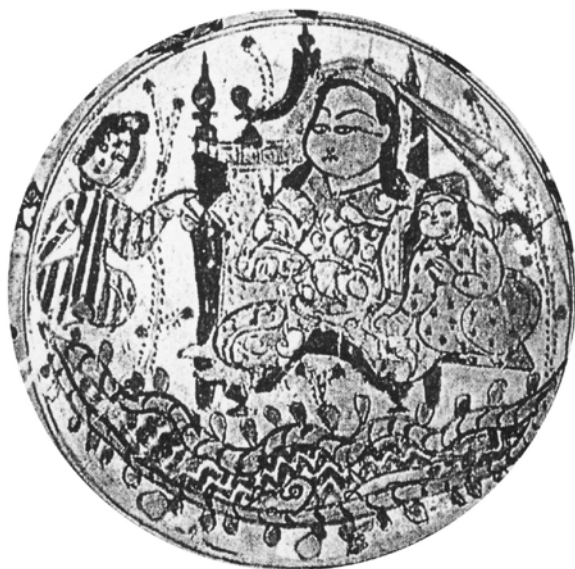
تصویر ۵. نشستگاه تاجدار