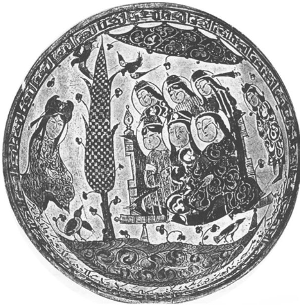
تصویر ۷. نشستگاه چندنفره مأخذ: Pope, VOL10, 1971: 687