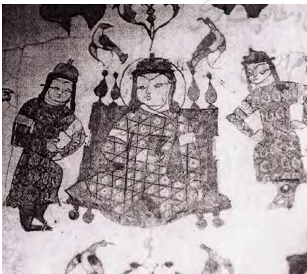
تصویر ۳. نشستگاه سلجوقی، کاسه مینایی.