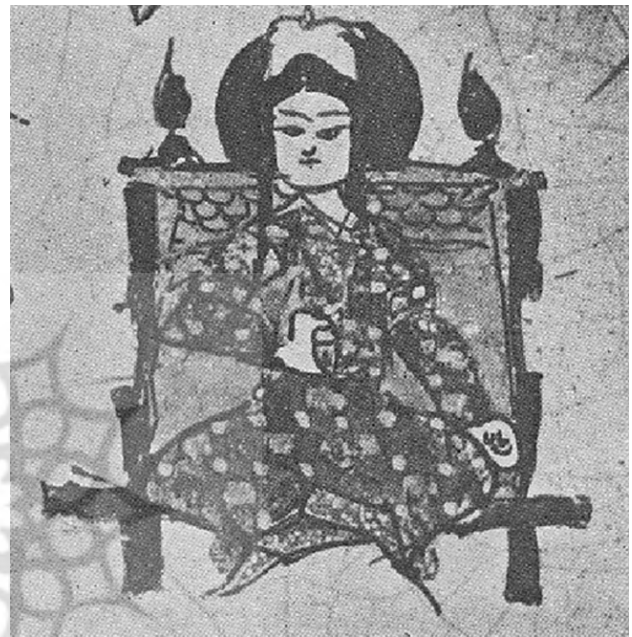
تصویر ۲. تخت سلجوقی، کاسه مینایی، ری.

می‌کند، می‌گیرد" (رید، ۱۳۷۱:۲۲۳) و هر آنچه ما انجام می‌دهیم در درون ساختارهای اجتماعی صورت می‌گیرد، بنابراین از آنها تأثیر می‌پذیریم (رامین، ۱۳۸۹:۱۷) از این رو این نکته را می‌بایست مورد توجه قرار داد که هنرمند-مبل‌ساز عصر سلجوقی در دوره‌ای می‌زیسته که از یک سو وارث الگوهای ساختاری و تزئینی مبلمان ایرانی پیش از سلجوقی بوده و از سوی دیگر می‌بایست پاسخگوی نیازهای کاربردی و رفتاری کاربران (حاکمان سلجوقی) باشد.