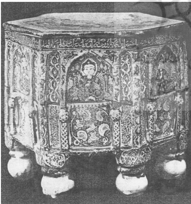
تصویر ۸. چهارپایه از کاشی منقش مینایی