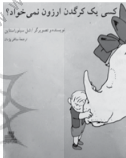
تصویر شماره ۴: روجلد به سبک اکسپرسیونیسم،