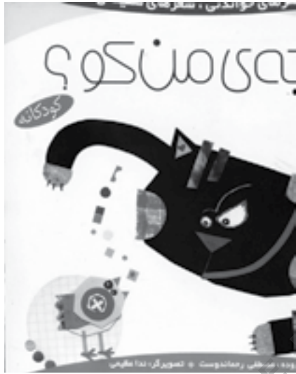
تصویر شماره ۶: روجلد به سبک کوئیسیم، مأخذ: (آرشیونگارنده)