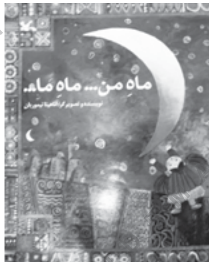
تصویر شماره ۳: روجلد به سبک سورئالیسم،

۱- کتاب سخت [۲۲] : شامل ورق‌های مقوایی کلفت و بادوام است. برای کودکان زیر سه سال استفاده می‌گردد؛ به همین دلیل تصاویر بزرگ، ساده و بدون سایه‌روشن مورد نیاز است. مجموعه‌های دنباله‌دار مانند جانوران، گیاهان و... با هدف شناخت محیط برای این گروه کتاب‌ها مناسب است.