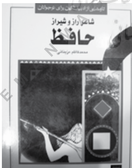
تصویر شماره ۸: روجلد به سبک آنفانتیلیسم، مأخذ: (آرشیونگارنده)

۲- کتاب حمام [۲۳] : از جنس نرم، پلاستیکی و مقاوم در برابر رطوبت است. تصاویر ساده و ابتدایی دارد و در ذهن کودک همبازی او در حمام خواهد بود.