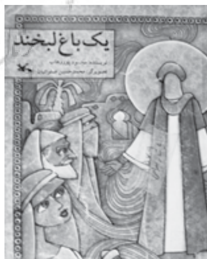
تصویر شماره ۵: روجلد به سبک نایف،