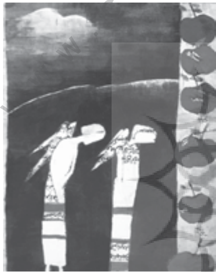
تصویر شماره ۷: روجلد به سبک آبستره، مأخذ: (آرشیونگارنده)