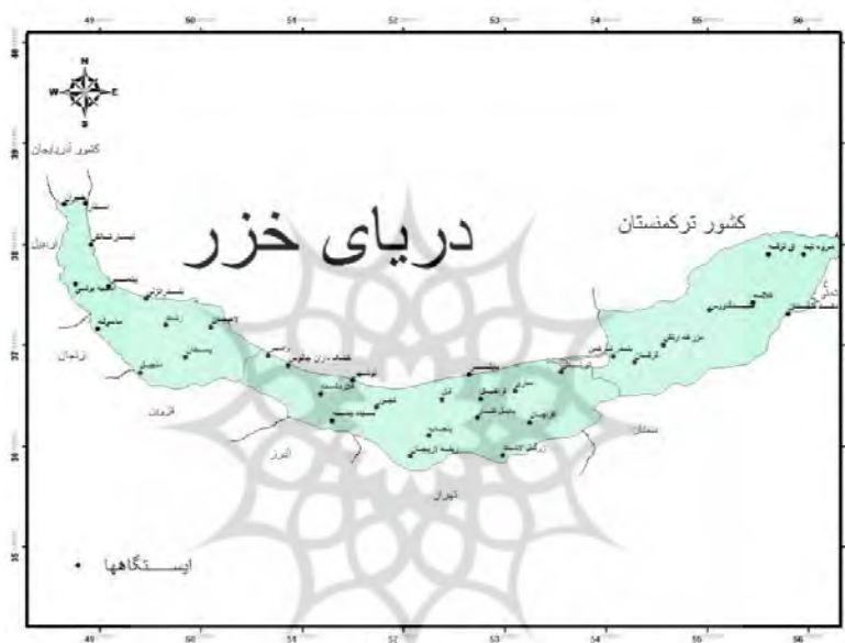
شکل (۱) نقشه پراکندگی ایستگاه‌های منطقه مورد مطالعه (شمال ایران)