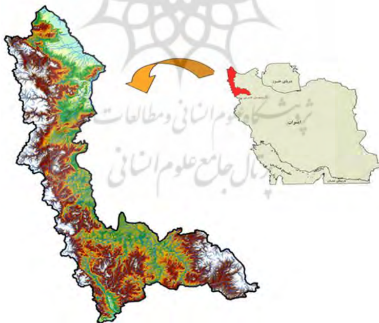
شکل ۲: موقعیت جغرافیای استان آذربایجان غربی

بر اساس آخرین تقسیمات سیاسی کشور، گستره کشور جمهوری اسلامی ایران به ۳۱ استان تقسیم شده است و استان آذربایجان غربی یکی از استان‌های منطقه آذربایجان محسوب شده که در شمال غربی ایران قرار دارد. استان آذربایجان غربی با لحاظ نمودن مساحت دریاچه ارومیه ۳۹۴۸۷ کیلومترمربع معادل ۲/۴ درصد از مساحت کشور وسعت دارد (شکل شماره ۲). بر اساس آخرین تقسیمات کشوری، استان آذربایجان غربی به ۱۴ شهرستان تقسیم شده است که از نظر جمعیتی شهرستان ارومیه با سهم نسبی ۳۰/۰۳ درصد در سال ۱۳۸۵ پرجمعیت‌ترین و شهرستان چالدران با ۱/۶ درصد از جمعیت استان، کم جمعیت‌ترین شهرستان استان بوده‌اند.