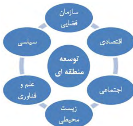
شکل شماره ۱: معیارهای توسعه منطقه ای