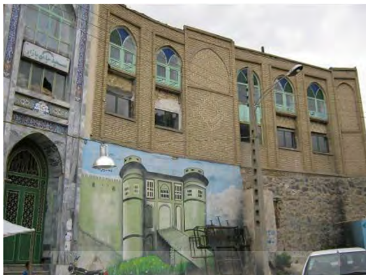
نمای مسجد جامع به میدان قیصریه