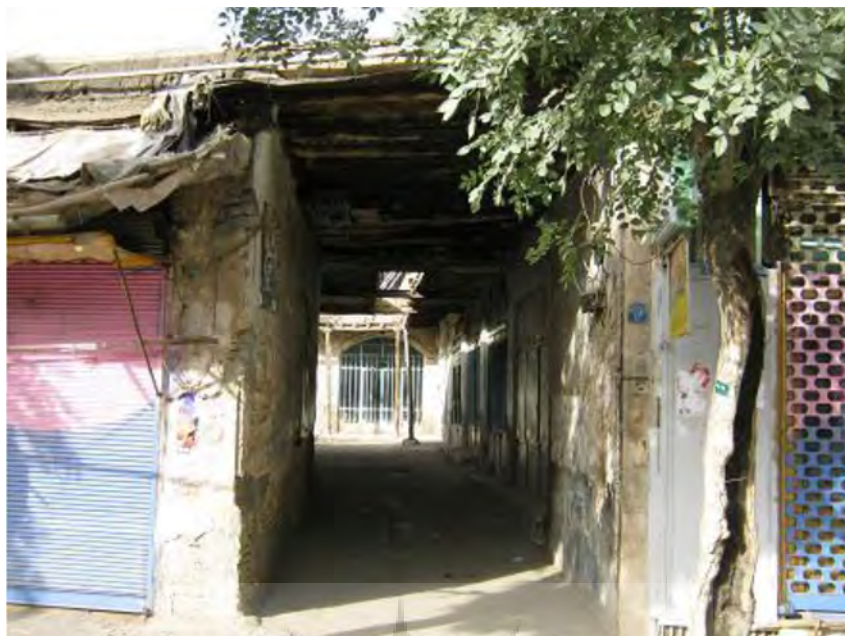
عکس ورودی کاروانسرای سعادت به خیابان ۱۷ شهر یور