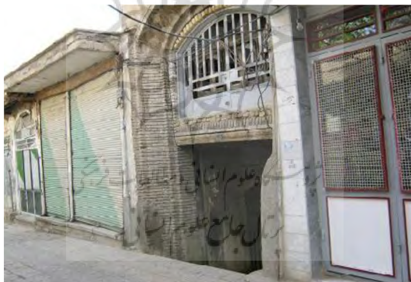
عکس ورودی کاروانسرای سعادت به راسته‌ی صمصام