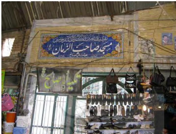
عکس مسجد صاحب الزمان