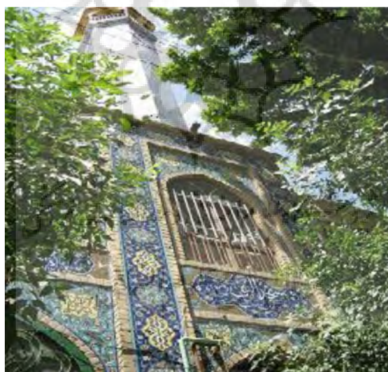
عکس مسجد النبی (درب سرداب)

مسجد النبی در بازار سرداب نبش خیابان ۱۷ شهریور واقع شده است.