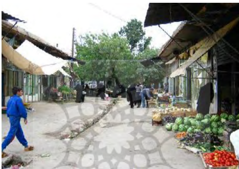
عکس میدان پا قلعه

پا قلعه‌ی دوم میدان دیگریست که محل برگزاری تعزیه در ایام سوگواری ماه محرم و صفر است و هنوز این نقش را حفظ کرده است.