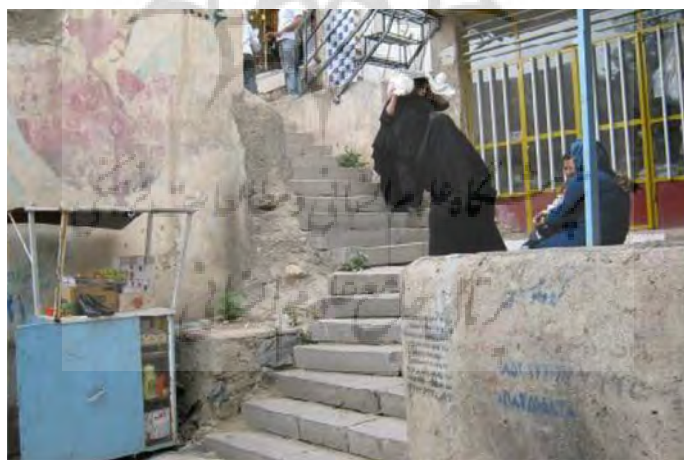
عکس پله‌ی بازار (ورودی قیصریه)