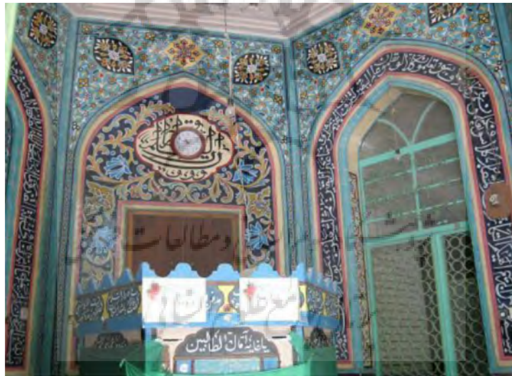
عکس امامزاده ابراهیم و اسماعیل

امامزاده ابراهیم و اسماعیل که در مسجدالنبی در بازار در سرداب واقع است.