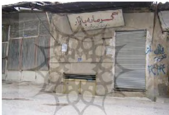
عکس حمام بازار

حمام بازار، روبه‌روی مسجد جامع در سمت دیگر خیابان و کنار راسته‌ی ارسی دوزها واقع شده است. این حمام مثل اکثر حمام‌های قدیمی چند پله از کف بازار و معبر اصلی پائین‌تر بوده است. حمام بازار در گذشته متعلق به محمد میرزا پسر امیر تومان نوه‌ی فتحعلی شاه قاجار بوده که وقف عام شده و زیر نظر اداره اوقاف شهرستان بوده و در زمره‌ی آثار ملی ایران در تاریخ ۱۳۸۴/۴/۵ به شماره‌ی ۱۱۹۵۴ به ثبت رسیده است.