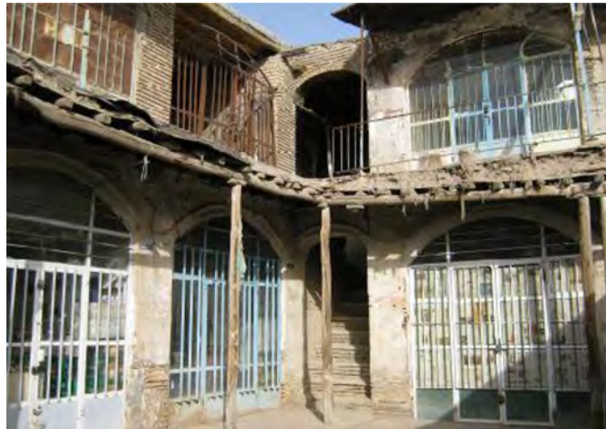
عکس نمای داخلی کاروانسرای سعادت