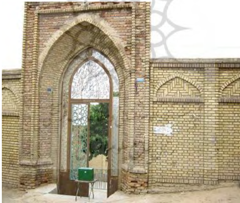
نمای ورودی مسجد جامع به بازار

مصالح به کار رفته در بنای مسجد شامل آجر با ملات گچ و خاک است. مسجد دارای سه در ورودی است. یکی از درها به طرف بازار قدیمی باز می‌شود و بالاتر از کف شبستان مسجد قرار دارد. دو در دیگر نیز به طرف حیاط قدیمی مسجد باز می‌شوند. مسجد جامع نهاوند از سادگی ویژه‌ای برخوردار است و هیچ اثر و نشانه‌ای از تزیینات، مانند گچ‌بری، کتیبه و ... در جبهه داخلی و بیرونی بنا دیده نمی‌شود. تنها تزیین مسجد کتیبه‌ی سنگی کوچکی به ابعاد ۲۵ در ۵۰ سانتی‌متر و مربوط به دوره‌ی سلجوقیان است. در اطراف این کتیبه و بالای آن به خط کوفی جملات لا اله الا الله و محمد رسول الله نوشته شده است. کتیبه در داخل محراب مسجد قرار دارد و در بالای قوس محراب، لوحه سنگی کوچک نصب شده که شامل تاریخ تعمیر مسجد در دوره‌ی صفویه است. این اثر به شماره‌ی ۱۷۰۶ در تاریخ ۱۳۶۵/۰۳/۰۷ در فهرست آثار ملی ایران به ثبت رسیده است.