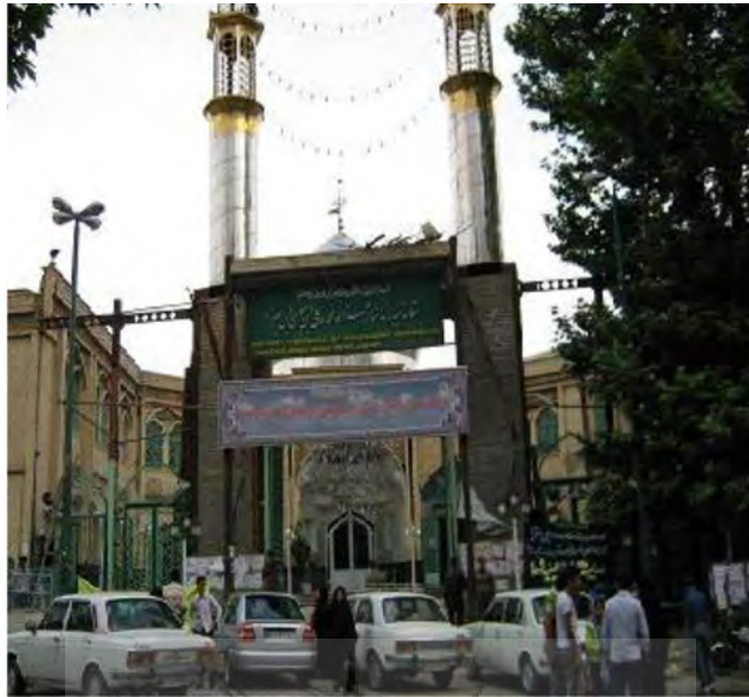
عکس آستانه مبارکه شاهزاده محمد و علی ابن موسی ابن جعفر

امامزاده ابراهیم و اسماعیل که در مسجدالنبی در بازار در سرداب واقع است.