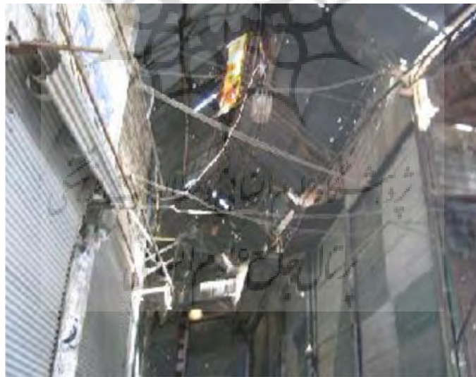
عکس نمایی از سقف بازار

معمولاً ارتفاع سقف بازار نسبت به فضاهای مشابه در نقاط دیگر کوتاه‌تر ساخته شده است زیرا امکان گرم کردن و جلوگیری از نفوذ سرما در سقف‌های کوتاه سهل‌الوصول‌تر است. ارتفاع سقف در بازار نهاوند به طور تقریبی هفت تا هشت متر است، که نشانه‌ی تطابق کامل با شرایط محیطی، به ویژه اقلیمی است.