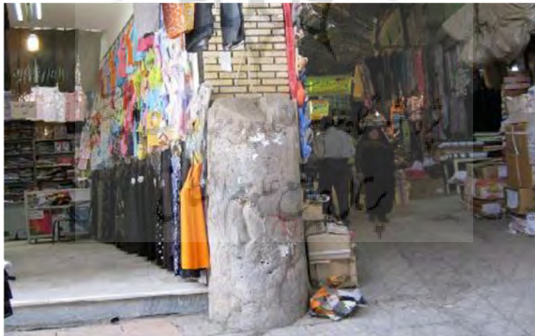
عکس سنگ میل

سنگ میل ستونی است که در تقاطع راسته‌ی صمصام با راسته‌ی سنگ میل قرار دارد. برخی معتقدند بر اثر حفاری‌های متعددی که برای یافتن آثار معبد سلوکیان در نهاوند صورت گرفته ستون‌ها و سرستون‌ها و سنگ‌های تراش‌خورده‌ی زیادی یافت شده که متعلق به معبد سلوکیان است. اما برخی دیگر معتقدند این‌ها متعلق به حمام‌های دوره‌ی قاجار هستند و هیچ ارتباطی به معبد ندارند.