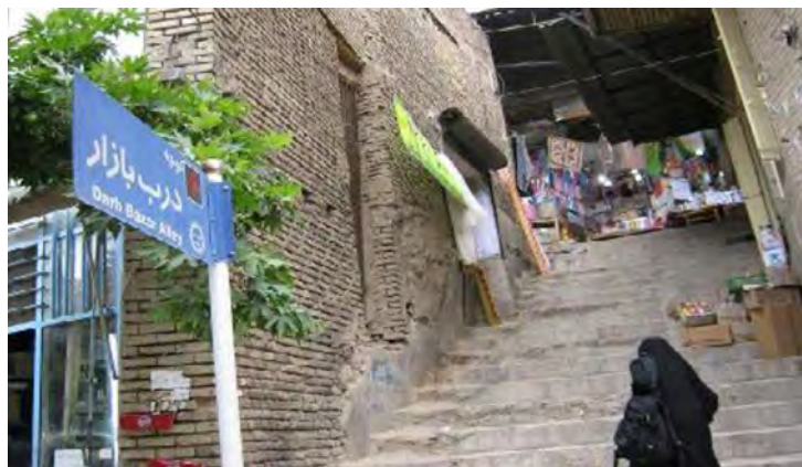
عکس پله‌ی بازار (ورودی اول)