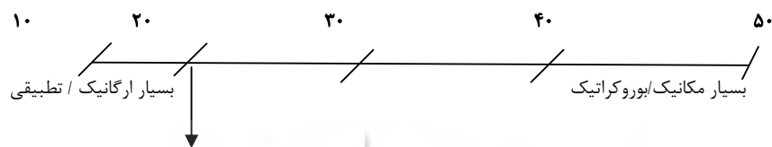
شکل شماره (۲)

طراحی محیط مناسب یادگیری است. این سازماندهی در دانشگاه‌های مرسوم به عهده استادان است و مدیریت دانشگاه نظارت چندانی بر آن ندارند در صورتی که در دانشگاه پیام نور این وظیفه را خود سازمان به عهده دارد. جایگاه این دانشگاه با امتیاز کسب‌شده بر روی پیوستار ساختاری مکانیک یا ارگانیک بودن در شکل شماره (۲) مشخص شده است. لازم به ذکر است \geq 50 امتیاز در نظر گرفته شده به وسیله کاندیدان این پرسش‌نامه ۵۰٪ بیشتر از ۵۰٪ می‌باشد (ساشکین و موریس ۱۹۸۴).