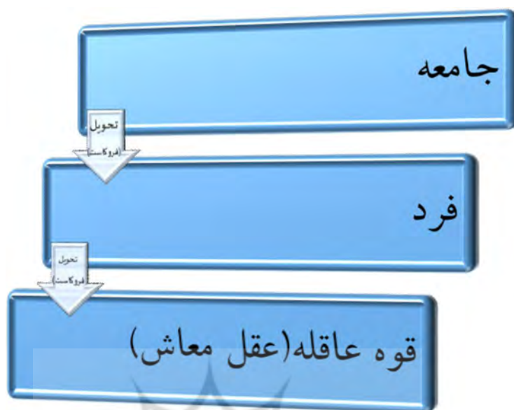
شکل شماره ۴: تحویل در بعد هنجاری اقتصاد متعارف