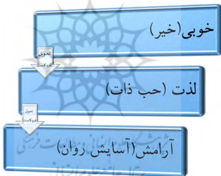
شکل شماره ۳: تحویل در بعد هنجاری اقتصاد متعارف

در نهایت اگرچه در ابتدا نیز تذکر داده شد، هدف از ارائه این بخش بیشتر طرح بحث برای تحقیقات آتی است، اما به نظر می‌رسد شاید بتوان گفت در اقتصاد اسلامی تحویل گزاره خوبی و خیر، به حب الذات و یا لذت و لذت به آرامش درون که در شکل شماره ۳ نمایش داده شده است، می‌تواند ثمرات بسیار مفیدی به ارمغان بیاورد.