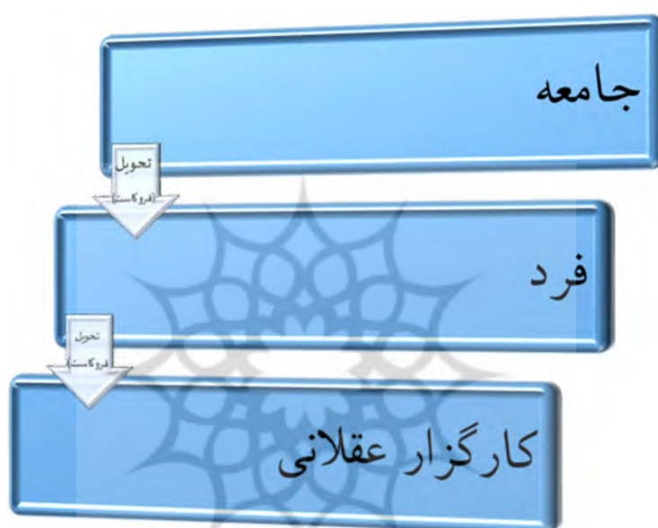
شکل شماره ۲: تحویل در بعد اثباتی اقتصاد متعارف

نئوکلاسیک که از آن می‌توان به هسته سخت این دانش که مورد توافق اغلب اقتصاددانان می‌باشد، یاد کرد، در بعد اثباتی دانش اقتصاد جهان هستی، جامعه را به فرد و فرد را به ابزار عقلایی تحویل می‌برد و از این طریق به مطالعه رفتارها و روابط پیچیده اقتصادی می‌پردازد که به طور خلاصه در شکل شماره (۲) نشان داده شده است. در بخش بعدی این پژوهش به بررسی امکان این تحویل‌گرایی در اقتصاد اسلامی خواهیم پرداخت.