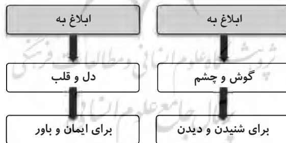
نمودار (۳) مقایسه دو نوع تبلیغ دین

از مطالب پیش‌گفته برمی‌آید که روح عطوفت و احساس در روش تبلیغی پیامبر می‌جوشیده و او برای ادای واجب انجام وظیفه نمی‌کرده؛ بلکه عشق و آگاهی در وجود او موج می‌زده و مردم نیز کاملاً آگاه بودند که ماجرا این نیست که اندیشه‌ای بخواهد زندگی آنها را برای مصلحت خویش فتح کند؛ بلکه رسالتی می‌خواهد آنها را از ظلمت‌های گذشته و پریشانی‌های حال نجات داده، به‌سوی حیاتی والا در دنیا و آخرت برساند. (فضل‌الله، ۱۳۸۴: ۱۳۱ - ۱۳۰) آیات و روایات پیش‌گفته به‌خوبی نشان می‌دهد که مبلغ دین، وظیفه‌ای فراتر از ابلاغ ساده و عادی دارد. وظیفه مبلغ دینی ابلاغی است که در نهایت به ایمان و باور مخاطب بینجامد.