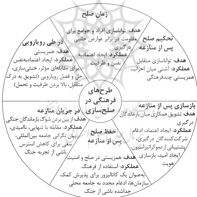
شکل ۲: نقش طرح‌های فرهنگی در صلح‌سازی