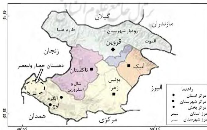
شکل ۱- موقعیت منطقه مورد مطالعه در استان قزوین

قلمرو جغرافیایی تحقیق، دهستان حصار ولیعصر از توابع شهرستان بوئین‌زهرا در جنوب غربی استان قزوین است که از شمال و غرب به استان زنجان، از جنوب به استان همدان و از شرق به دهستان خرقان محدود است (شکل ۱). قلمرو زمانی تحقیق سال ۱۳۹۲ می‌باشد.