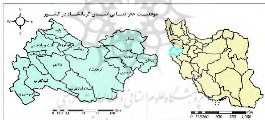
شکل ۱- موقعیت جغرافیایی استان کرمانشاه و شهرستان های آن در کشور