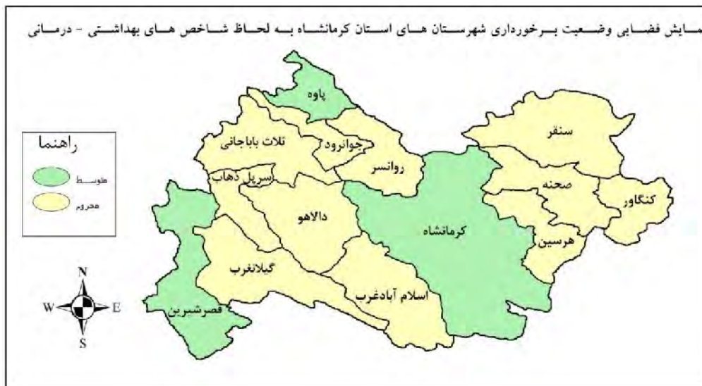
شکل ۲: نمایش فضایی شهرستان های استان کرمانشاه به لحاظ توسعه یافتگی در شاخص های بهداشتی درمانی

نمایش فضایی شهرستان های استان، در شاخص های بهداشتی درمانی، نشان می دهد که فضای توسعه غالب بر شهرستان های استان، غالباً فضایی محروم است. چرا که حدود ۷۹ درصد شهرستان های استان در سطح توسعه محروم واقع شده اند. دو شهرستان مرزی قصرشیرین و پاوه و شهرستان کرمانشاه (مرکز استان) نسبت به دیگر شهرستان های استان، وضعیت بهتری داشته و در سطح توسعه متوسط واقع شده اند. در مجموع با توجه به اینکه هیچ یک از شهرستان های استان در سطح توسعه بالا واقع نشده اند می توان وضعیت کلی استان را به لحاظ توسعه-یافتگی در شاخص های بهداشتی درمانی ضعیف عنوان کرد.