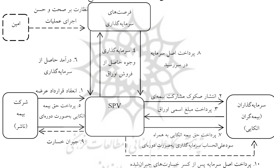
مدل عملیاتی انتشار مشارکت بیمه‌ای نوع اول