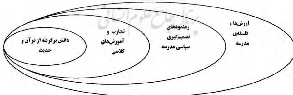
شکل ۱: محوریت قرآن و حدیث در فرآیند تدوین برنامه‌ی درسی آموزش سلامت جنسی - اقتباس از سانجاکدار (۲۰۰۶)

سانجاکدار ، لزوم توجه به پرورش انسان‌هایی خود ساخته که بتوانند در موقعیت‌های گوناگون با تقوای الهی عفت خود را حفظ کنند را از اساسی‌ترین اهداف تربیت اسلامی می‌داند (۲۰۰۴). البته از دیدگاه وی، در اغلب جوامع از جمله جوامع اسلامی این اعتقاد وجود دارد که فرزندان باید نسبت به ماهیت رشد جنسی خود آگاهی یابند. ماهیت مثبت و خدایی تمایلات جنسی گناهی نیست که باعث شرمندگی انسان شود (۲۰۰۵). در قرآن و احادیث تأکید زیادی بر کسب دانش در همه‌ی جنبه‌ها وجود دارد. در زمان پیامبر اکرم (ص) مردان و زنان مسلمان به راحتی در مورد مسایل شخصی از جمله مسایل جنسی خود، سؤالاتی را می‌پرسیدند (۲۰۰۵). اولیای دانش آموزان مسلمان در جست‌وجوی آموزشی هستند که اخلاقیات، اعمال، خصوصیات و رفتارهای اسلامی را حفظ نماید (۲۰۰۵). اما این که این کار توسط چه کسی و چه زمانی بایستی ارائه شود، موضوعی قابل مناقشه در میان اولیا، مربیان و فرزندان است. اضافه بر این‌که، بسیاری از دانش‌ها و اطلاعات جنسی مربوط به سلامت جنسی را می‌توان بر مبنای آموزش، اصول و عقاید اسلامی که مبتنی بر قرآن و حدیث است، ارائه نمود (۲۰۰۰). به عبارت دیگر، آموزش‌های اسلامی، قرآن و حدیث باید کانون تصمیم‌گیری‌ها تلقی شود (شکل ۱). در این نمودار از قرآن و حدیث، به عنوان منابع اصلی، اولین گام منطقی است: «قرآن، زندگی پیامبر و اهل بیت منابع بی‌آلایش و گشوده‌ای هستند که می‌توانیم پاسخ تمامی سؤالاتمان را در آن‌ها بیابیم. بنابراین بایستی به قرآن و حدیث برگردیم، آن‌چه را که درون آن است شناخته و در اختیار دانش‌آموزان قرار دهیم».