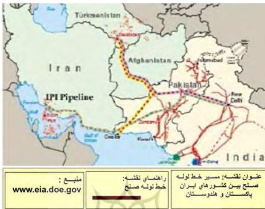
نقشه شماره ۲: مسیر خط لوله صلح

جهان مبدل می‌کند چرا که هژمونی انرژی توان و قدرت ایران را افزایش می‌دهد.