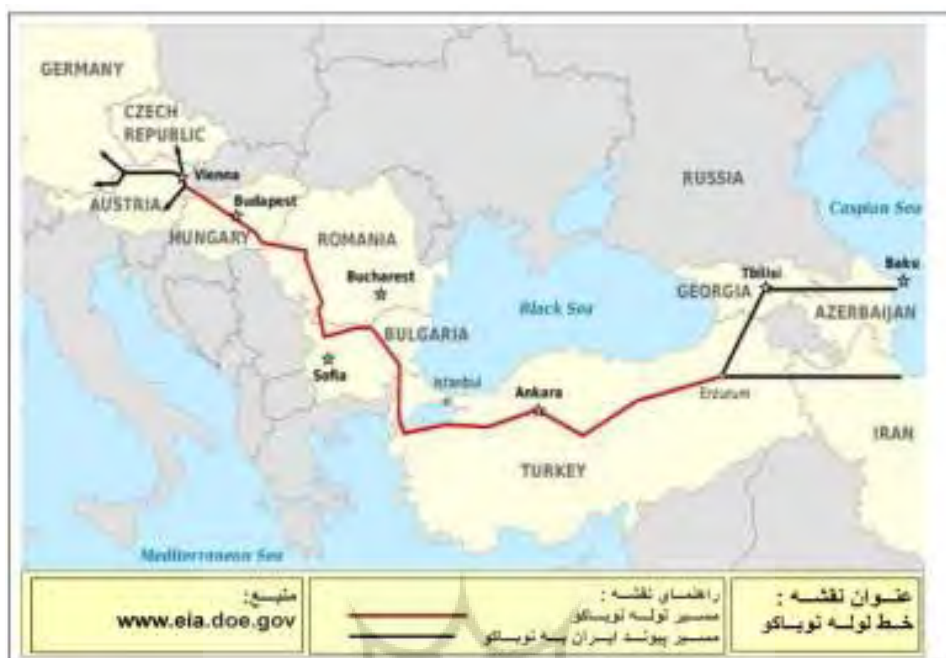
نقشه شماره ۱: مسیر خط لوله نوباکو

جنوبی، هند و پاکستان از واردکنندگان عمده گاز در آسیا می‌باشند که ایران قراردادهایی را با آنها به امضاء رسانیده است. مهمترین طرح انتقال گاز در این منطقه خط لوله صلح می‌باشد که قرار است گاز ایران را به پاکستان و هندوستان صادر انتقال دهد. اما تا حالا این پروژه به دلیل اختلافات سیاسی بین هند و پاکستان عملی نگشته است. در خرداد ۱۳۸۹ ایران و پاکستان به توافق نهایی در زمینه صادرات گاز ایران به پاکستان رسیدند و قرار شده است که از سال ۲۰۱۴ روزانه ۲۱/۵ میلیون متر مکعب گاز به پاکستان برای مدت ۲۵ سال صادر شود.