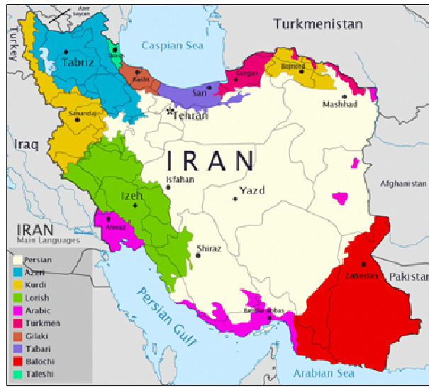
شکل (۴) توزیع پراکندگی و زیستگاه‌ها و قلمرو اجتماعات ایرانی

داری داشته و کشمکش‌های درونی اقمار بعضاً برای ارتقا قدرت مدنی منظومه و حراست از مجموعه بوده و تمایلات جدایی طلبی و استقلال از هسته مادر مد نظر نبوده است.