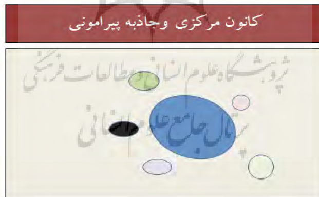
شکل (۵) کانون و هسته ایران مرکزی و اقمار آن

در اینجا ایران مرکزی و قدرت مدنی زایی آن، نیرو یا کهربای اصلی پایداری منظومه و اقمار فرض شده است. سابقه تاریخی نشان می‌دهد که نوسان قدرت و ظرفیت مدنیت زایی این هسته با دوران شکوفایی و مشارکت و نقش آفرینی اقمار آن پیوستگی معنی