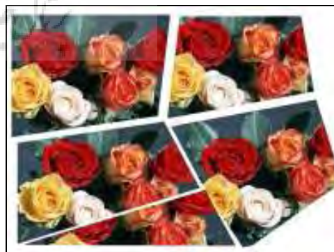
شکل (۷) تمثیلی از هویت آینه ای

حال اگر دسته گل در مقابل آینه ای قرار گیرد و آینه شکسته شود درخواستیم یافت که اگرچه آینه به قطعات متعدد تقسیم شده است ولی درهریک از قطعات آینه، کل دسته گل دیده میشود و نمی‌توان با شکستن آینه آنها را از یکدیگر منفک و جدا ساخت به چنین تعبیری هویت آینه ای گفته میشود، و این مفهوم براین مدعا دلالت دارد که پاره ای از محیط‌ها و سرزمین‌ها خاصیتی جیوه ای از خود بروز میدهند، که ذاتا و ماهیتا خاصیت آینه ای داشته کسر پذیر نیستند. شکل (۷)