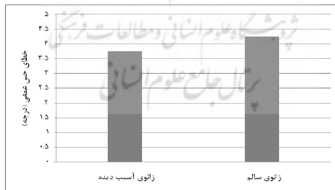
شکل ۲. میانگین خطای حس عمقی در زانوی سالم و آسیب دیده

نتایج تحقیق حاضر نشان داد که میزان خطای حس عمقی در زانوی آسیب دیده نمونه‌ها اندکی کمتر از زانوی سالم بود اما این تفاوت معنادار نبود ( P > 0.05 ) (شکل ۲).