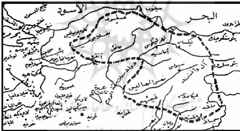
نقشه شماره ۱: محل استقرار دولت دانشمندیان در آسیای صغیر (مناطق داخل خطوط نقطه چین). (برگرفته از کتاب الدانشمندیون، ص ۲۴۴).

امیر احمد دانشمند پس از تصرف شهر سیواس و استقرار در این شهر، برج و باروهای این شهر را تعمیر نموده، مساجدی را در آن بنیان نهاد و این شهر را به عنوان پایگاهی درآورد که ترکان مسلمان از آنجا به اعماق نواحی داخلی آناتولی حمله می‌بردند. وی از همان آغاز تعدادی از سرداران دلیر و مبارز مانند سلیمان بن نعمان و یحیی بن عیسی را با خود همراه ساخته و از وجود این سرداران دلیر و نیروهای جنگجو برای رسیدن به اهداف بلند خود استفاده می‌کرد؛ برای نمونه یحیی بن عیسی، چندین زبان می‌دانست و به برکت حضور همین شخص بود که امیر احمد دانشمند می‌توانست میان دشمنان خود تفرقه انداخته و یا اطلاعات ارزشمندی درباره اوضاع سرزمین‌های مجاور با قلمرو خود به دست آورد. (القرمانی، بی‌تا: ۲۹۲). به این ترتیب امیر احمد دانشمند طی بیش از بیست سال حاکمیت خود بر دانشمندیان (از ۴۷۷ تا ۴۹۹ ه.ق.) حملات فراوانی را به مناطق داخلی آناتولی رهبری کرد. او توانست مناطقی مانند کاپادوکیه، توقات، نیکسار، آماسیه و حتی شهرهای بندری اطراف دریای سیاه را متصرف شود. کاری که جانشینانش نیز آن را ادامه داده و قلمرو دانشمندیان را روز به روز گسترده‌تر ساختند (آقسرای، ۱۳۶۲: ۱۷). (نقشه شماره ۱).