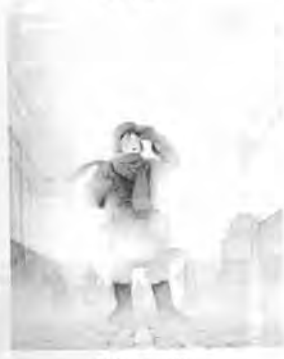
۱۷- ایربراش، از آمریکا

● فلم ایربراش (قلم یادی): وسیله‌ای ظریف، حسّاس و تواناست که رنگ را افشانه وار روی سطح می‌باشد و برای آفرینش تصویرهای واقعیت‌گرا، نشان‌دادن زرقا و دورنمای موجود در طبیعت مناسب است.