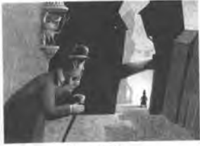
۱۶- خراش، از ترکیه

● اسکراچ بُرد (خراش روی مقوّا و کاغذ): این نوع تصویر، با ایجاد خراش بر روی مقوّا سیاه یا سیاه‌شده به وسیلهٔ ابزارهایی نوک‌تیز چون نیغهٔ لوزی شکل تخت یا لبهٔ گرد نیغهٔ جراحی لبهٔ گرد و اسکند جراحی ساخته می‌شود.